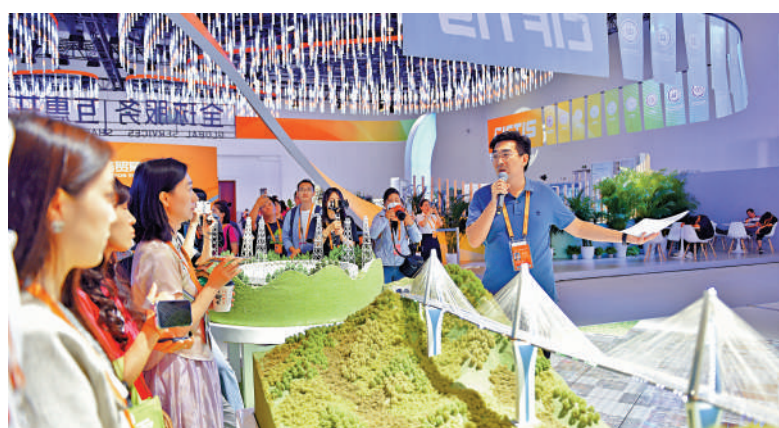
▲9月1日，工作人員在服貿會展區進行講解。

參加。記者1日走進國家會議中心，由多語種「你好」字牌搭建成的CIFTIS標識便映入眼簾，歡迎着各方來客。據介紹，年度主題專區面積為1.1萬平方米，吸引了54家企業參展。線下參展企業中，內資企業22家，外資（合資）企業13家，分別來自美國、瑞士、英國、法國、德國、荷蘭、澳洲、沙特阿拉伯、日本以及中國香港等10個國家和地區，國際化率達37%，世界500強及行業龍頭企業率為100%。