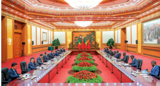
▲9月1日下午，國家主席習近平在北京人民大會堂同來華進行國事訪問的貝寧總統塔隆舉行會談。