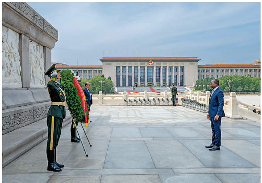
▲9月1日，貝寧總統塔隆前往天安門廣場，向人民英雄紀念碑敬獻花圈。

習近平指出，今年是我提出真實親誠對非政策理念10周年。10年來，中國對非洲朋友始終以誠相待，真心實意為非洲發展提供支持，中非合作已經成為南南合作和國際對非合作的典範。中方支持非洲成為世界政治、經濟、文明發展的重要一極，願以自身新發展為非方提供新機遇，同包括貝寧在內的非洲兄弟一道，落實好中非合作論壇成果，推動共建「一帶一路」倡議、全球發展倡議同非盟《2063年議程》及非洲各國發展戰略