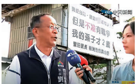
▲台中市豐原區豐田里里長架設大型看板，表達反戰願望。

譚克非指出，民進黨當局為一己私利，不惜用台灣老百姓的血汗錢討好美國，製造兩岸對立對抗，其所作所為正在把台灣變成「地雷島」「彈藥庫」，嚴重損害台灣同胞安危福祉。台美勾連完全是在「害台」「毀台」。頑固「倚美謀獨」，只會把台灣推向兵凶戰危的險境。中國人民解放軍始終保持高度戒備，堅決挫敗任何形式的「台獨」分裂行徑和外來干涉圖謀，堅決捍衛國家主權和領土完整。