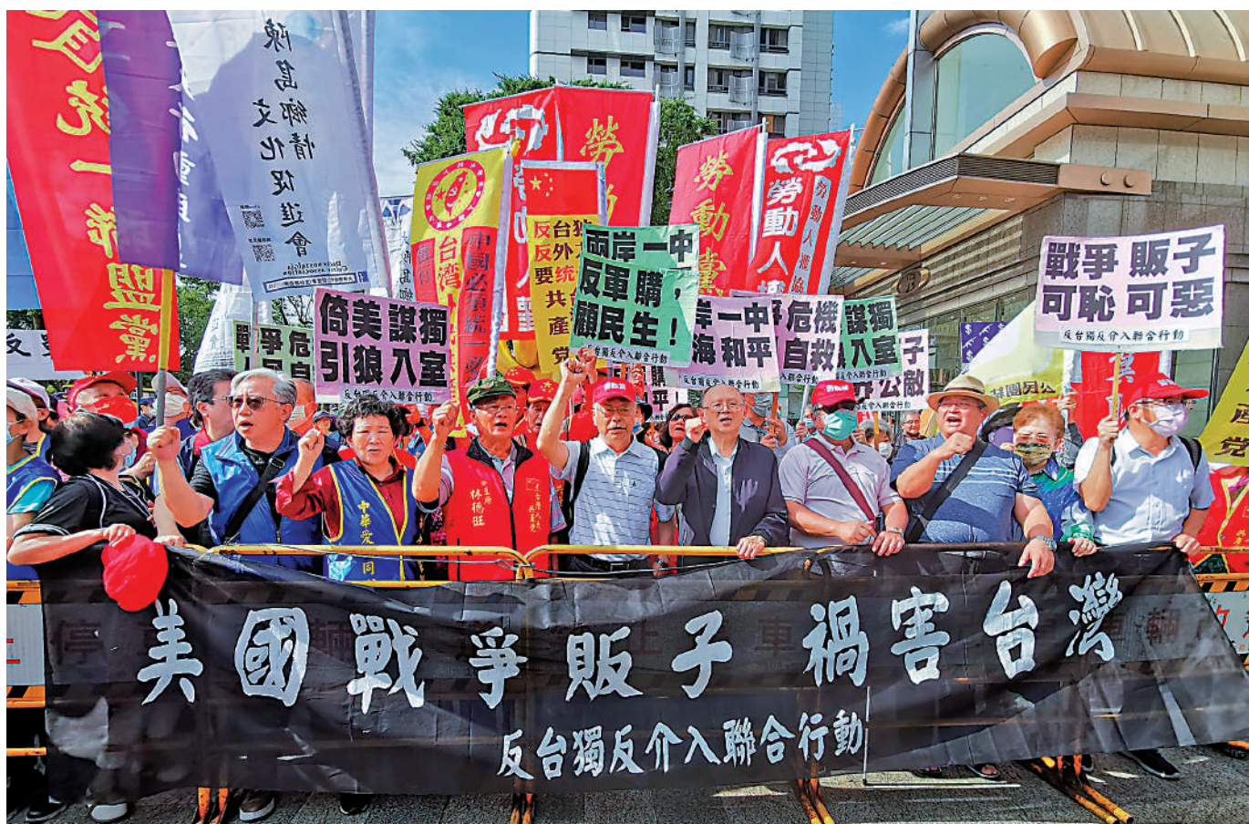
▲9月15日，中方宣布制裁兩家對台售武的美國軍工企業。圖為今年5月，台灣民眾抗議美國軍火商竄台販售戰爭。