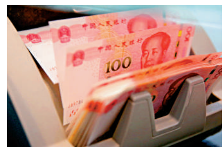
▲人幣兌美元連升五個交易日，累計漲1%。

觀調控政策效果逐步顯現，中國經濟有望持續回升向好，對外匯市場的支撐作用將進一步鞏固；主要發達經濟體的緊縮貨幣政策接近尾聲，有關外溢影響將總體弱化；近期中國跨境資金流動中的季節性因素等短期影響也會減弱。另一方面，當前中國外匯市場更趨理性和成熟，市場主體適應環境變化的能力進一步提升，外匯市場宏觀審慎管理工具更加完善，均有助於市場穩定。