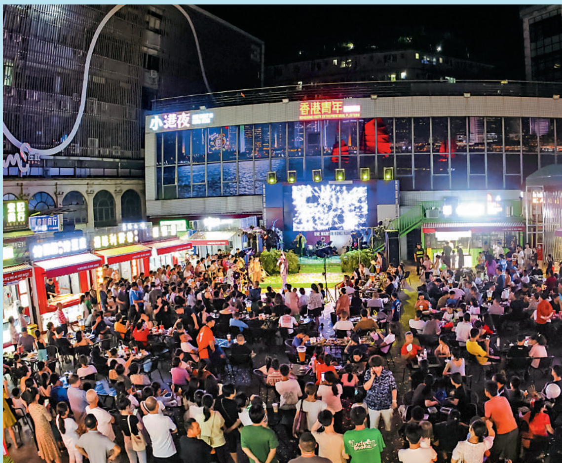
▲深圳夜經濟經久不衰，是鵬城經濟一大亮點。圖為深圳鹽田的「小港夜」夜市現場人潮湧動，座無虛席。