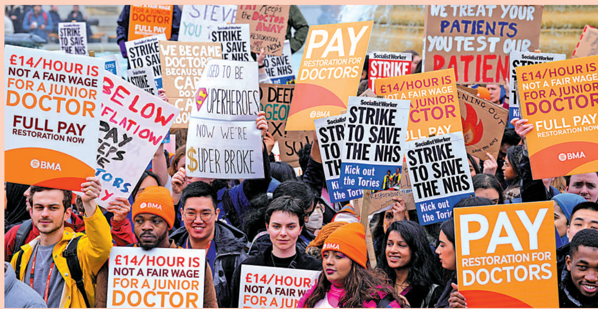
▲英國通脹嚴重，民生困苦，示威罷工浪接浪。圖為今年四月當地初級醫生發起罷工要求改善待遇。