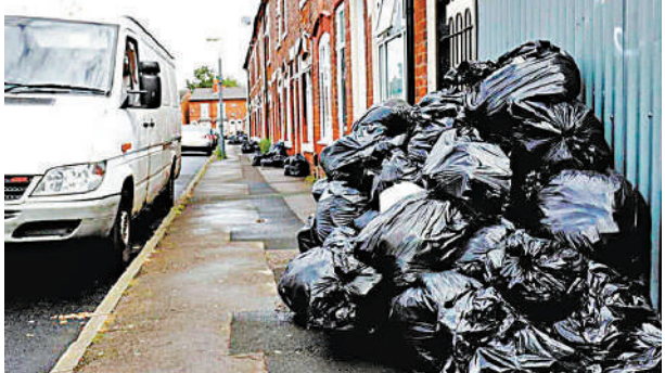
▲伯明翰政府破產後，區內垃圾也沒人處理，整個城市秩序混亂。

據媒體報道，有在伯明翰定居的港人表示，受市政府財困影響，已留意到市政服務出現變化，包括市面愈來愈多垃圾無人清理，「最近去市中心火車站，發現少了許多清潔工人，亦有很多垃圾堆積沒有人清理。」她又說，不少市政工程包括道路維修亦已暫時停工，現時市政府有提供交通補貼，差額由市政府支付給巴士公司，但補貼計劃直至今年10月底，相信很大機會取消。「簡直由第一世界去到第三世界！」伯明翰破產令