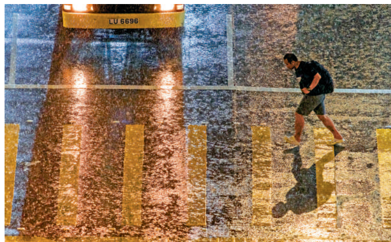
▲天文台兩天內第二次發出紅雨警告，沒帶雨傘的市民全身盡濕。

天文台指，一些低窪地帶及排水欠佳的地區會出現水淹，提醒市民採取適當的預防措施，大雨可能引致山洪暴發，市民宜遠離河道，並需繼續對暴雨可能帶來之危險提高警覺，有需要外出的人士應小心考慮天氣及道路的情況及注意安全。