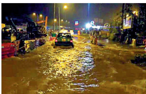
▲在紅雨下，西貢大涌口路水浸，水深大約有半個車輪。

【大公報訊】記者伍軒沛報道：極端天氣持續影響本港，繼上周世紀大黑雨的洗禮後，昨晚又風雲變色，突然而來落下傾盆「紅雨」，其中馬鞍山一小時雨量更破百毫米。天文台預測，一道低壓槽會在今日為華南及南海北部帶來大驟雨及雷暴，並預料一股東北季候風會在下周中至後期影響中國東南沿岸。