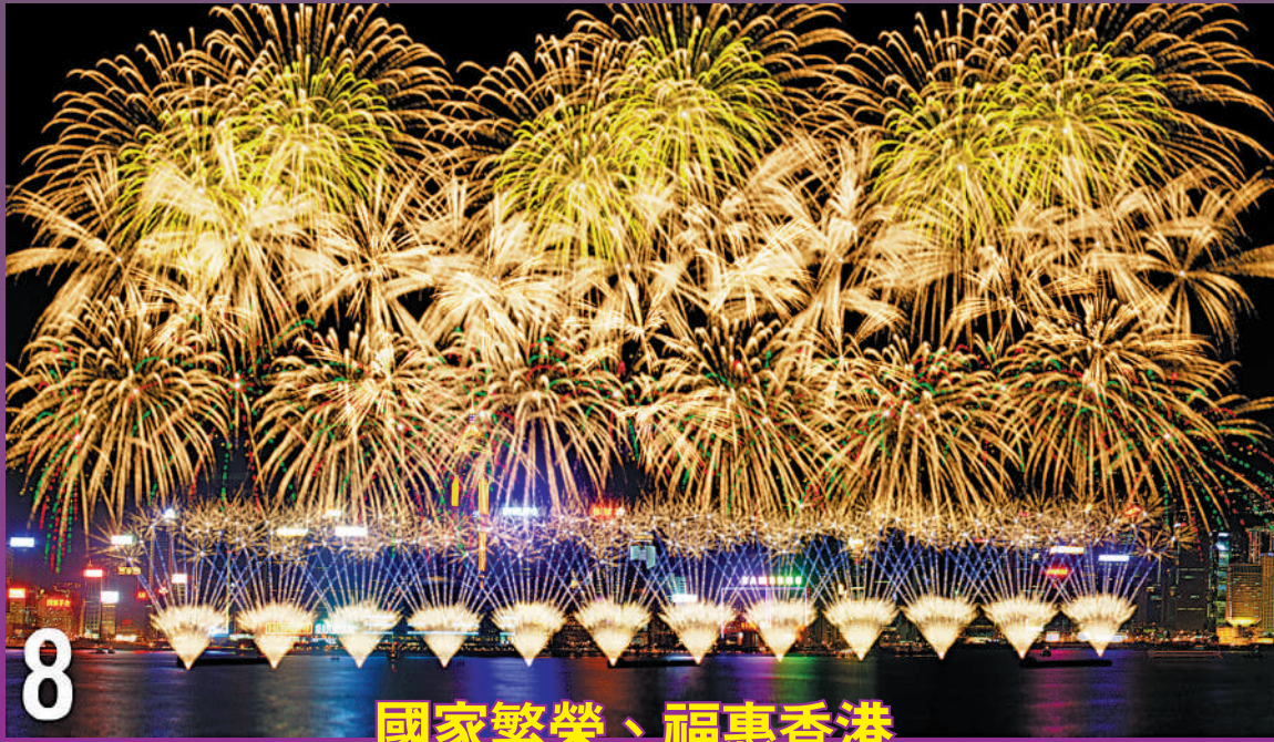
8 國家繁榮、福惠香港

由黃河協奏曲揭開，展示「大錦冠」及「錦棕櫚」圖案，以花團錦簇的景致象徵國家繁榮昌盛