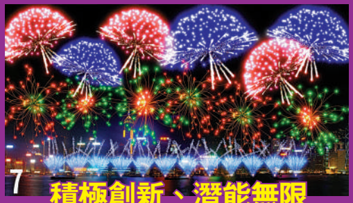
7 積極創新、潛能無限