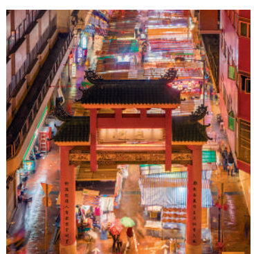
旅發局已初步接觸廟街商會，討論如何提升廟街氣氛。

黃偉倫又強調，飲食業界毋須擔心夜市與餐廳爭生意。政府推動夜市是想透過表演、體驗活動帶動人流和生意額，是互相補足，讓市民走出來帶動消費，對整個夜市有幫助。對於不少港人北上消費，他認為推出夜經濟活