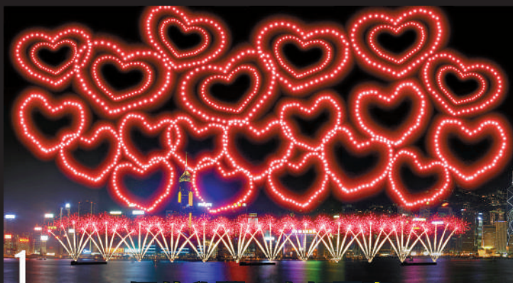
1 煙花欣躍、齊賀國慶