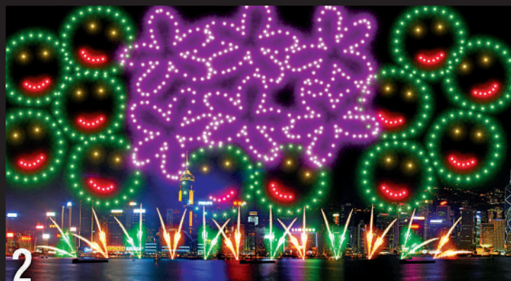
2 Hello HongKong, Happy HongKong