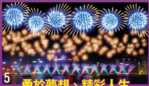
5 勇於夢想、精彩人生