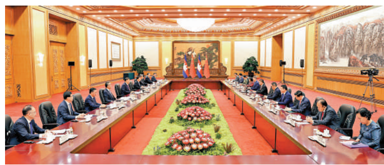
◀9月15日上午，國家主席習近平在北京人民大會堂會見來華進行正式訪問的柬埔寨首相洪瑪奈。

洪瑪奈表示，我把中國作為首個正式出訪的國家，就是為了體現柬新一屆政府將繼續堅定奉行對華友好政策，將柬中鐵桿友誼進一步發揚光大。柬方恪守一個中國原則，堅定支持中方維護自身核心利益，支持習近平主席提出的全球發展倡議、全球安全倡議、全球文明倡議。柬方感謝中方長期以來為柬經濟社會發展提供的大力支持和幫助，願同中方落實兩國領導人達成的重要共識，深化共建「一帶一路」合作，在「鑽石六邊」框架下推動兩國多領域合作進一步發展，打造中柬運共同體，造福兩國人民。柬方願同中方在地區和國際事務中密切配合，把柬中關係推向新高度。