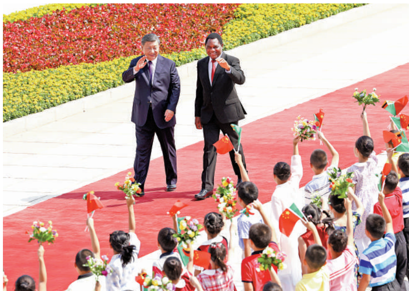
▶會談前，習近平在人民大會堂東門外廣場為希奇萊馬舉行歡迎儀式。