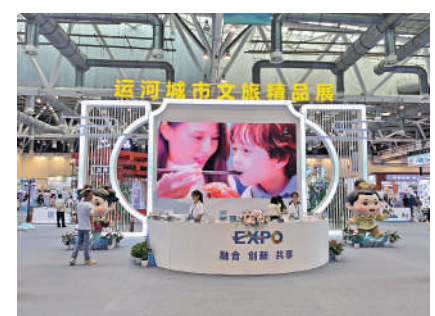
▲運河城市文旅精品展「一站式」打卡運河城市。

圈」，運河全流域有61個城市參展。運河城市文旅精品展帶領公眾「一站式」打卡各美其美的運河城市，「大運河元宇宙互動體驗專區」「長三角高鐵旅遊小城」展區、「行運青年，運河生活節」等專題板塊頗為吸睛。運河特色旅遊產品展彙集運河沿線城市新型旅遊裝備、沉浸式文旅體驗產品、鄉村民宿及演藝產品。