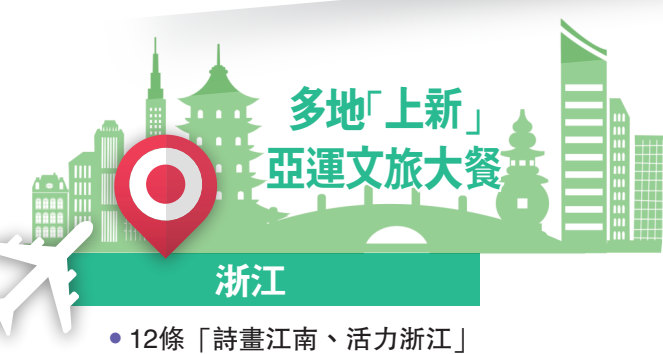
●12條「詩畫江南、活力浙江」主題漫遊長廊，匯集了浙江的青山綠水、人文風韻。

●「走讀千年運河，共享亞運盛會」「吟詩三江兩岸 體驗體育時尚」「有愛無礙，共享好運」（亞殘運主題一日遊）等十大亞運文旅精品線路。