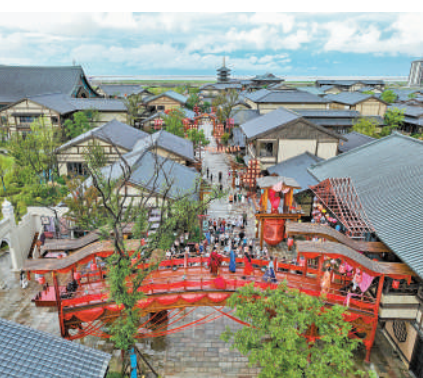
▲9月16日，遊客在江蘇東觀民俗表演。新華社

賽事「流量」正轉變為文旅「留量」。隨著「亞運經濟」漸熱，杭州旅遊消費溢出效應明顯，呈現輻射長三角區域的態勢。有預測數據顯示，本屆亞運會期間，杭州躋身「十一」國內遊熱門目的地前三名，當地將接待國內遊客約1848萬—2270萬人次，整體訂單預訂量同比增長超5倍，旅遊消費也將趕超往年亞運。此外，寧波、溫州、湖州、紹興、金華等亞運會分會場城市的旅遊熱度在近期出遊熱度也持續攀升。