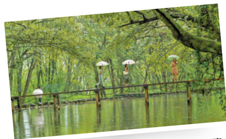
▲9月15日，遊客在黃山徽州古村遊覽。

同時，浙江省還發布了「看亞運 遊浙里」浙江十大亞運文旅精品線路。杭州市發放百萬份「亞運文旅大禮包」，內含杭州地鐵7日暢行卡、48家全市景點免門票暢遊、百元話費電話卡暢聊等內容。長三角地區各地市亦分別發布亞運優惠政策及文旅消費券，不少平台還推出