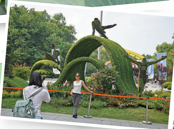
▲12日，杭州西湖景觀作品《一起向未來》吸引遊客。