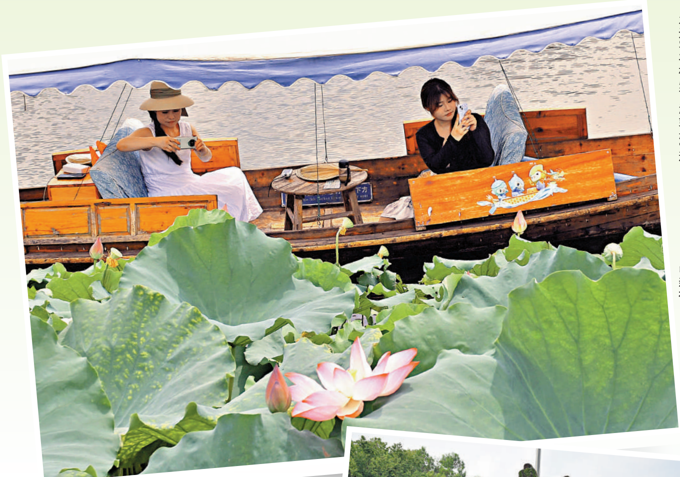
▲「亞運熱」讓杭州旅遊大熱，並輻射長三角。圖為遊客在杭州西湖乘船賞荷。