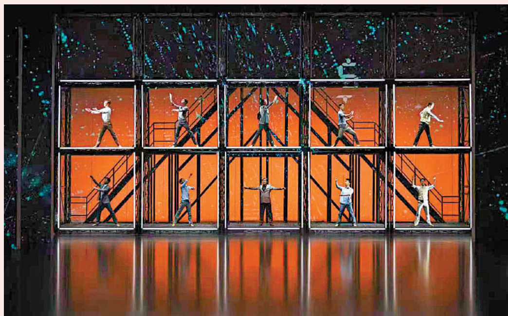
▲現實題材舞劇《到那時》今晚於香港文化中心大劇院迎來收官之夜。

佟睿睿強調「浪潮」等群舞段落，運用了現代舞的創作思維，融入了更多元的舞蹈語彙，突破了以古典舞為基礎的表演者們的身體界限，尋找到更具情感衝擊力的肢體表達。「從頭到尾都是肆意的荷爾蒙的力量，你會看到這一批就時代的浪潮不斷地奔湧過來，就像一浪拍過一浪，你又看到我們的這些歷史是這樣走過來的。」