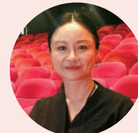
舞劇《到那時》導演 佟睿睿