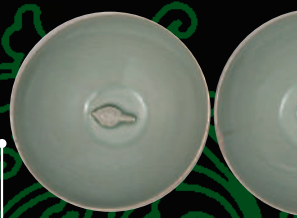
青釉貼花龍紋碗一對

上善堂這件藏品十分生動活潑，一對龍紋碗碗底內部可見小鳥龜，在碗中注入液體後，呈現出龜在水中游之感，很是得意。