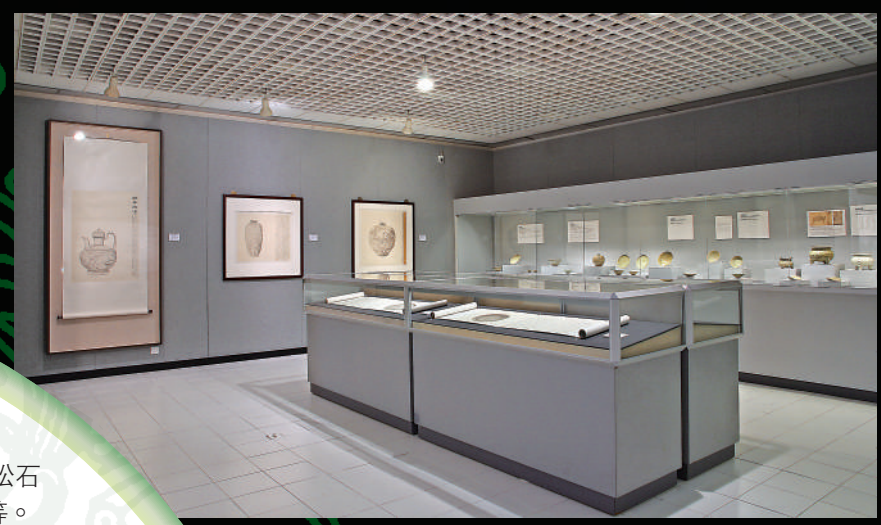
▲「青妝泯火：上善堂藏耀州窯瓷器」展覽現場。