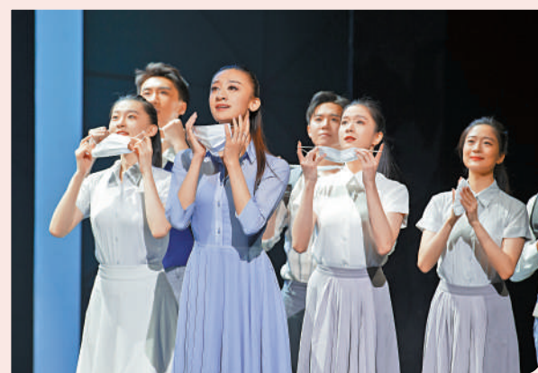
▶《到那時》通過獨舞、雙人舞、群舞等不同形態的舞段編排，呈現時代氣質。