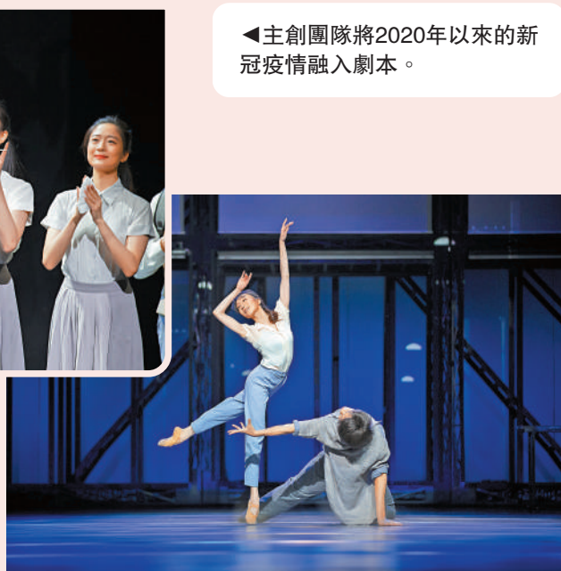
◀主創團隊將2020年以來的新冠疫情融入劇本。