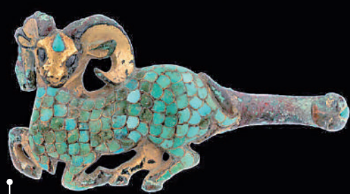
鑲嵌綠松石羊形鎏金帶鈎

這件戰國時期的帶鈎鈎體以青銅鑄造出生動的臥羊造型，羊頭鎏金，羊身鑲滿片狀綠松石，周邊有錯金線，造型精緻可愛。