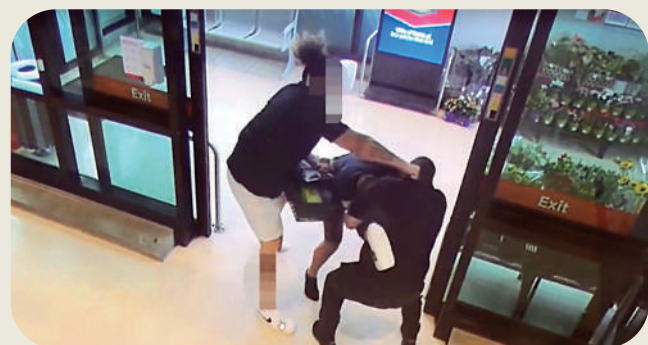
►兩名竊賊今年早些時候在新西蘭一家超市內毆打保安。網絡圖片