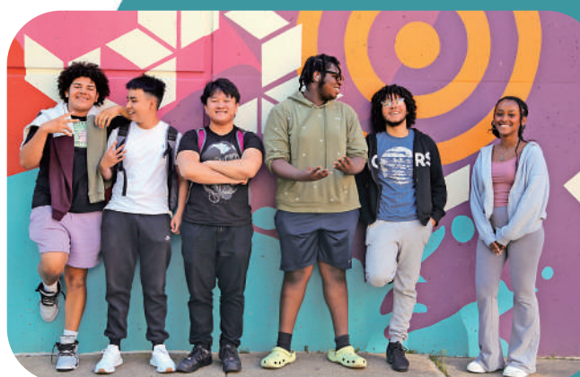
◀東北大學「微積分入門」暑期項目的參與者在校園內合影。