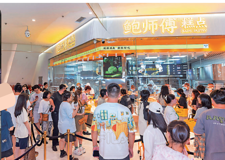
▲港人北上消費已是新常態。