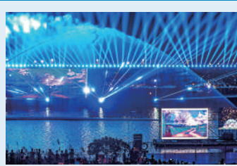
大公報記者方俊明整理

日期： 9月28日-10月3日 時間： 16時-20時42分/21時30分 地點： 橫琴天沐河賽艇公園 活動： 河畔音樂匯、水舞光影秀《我們的橫琴》、無人機天幕秀等