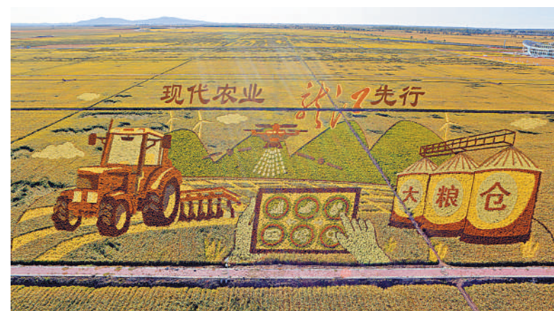
▲在黑龍江省富錦市萬畝水稻科技示範園拍攝的巨型3D稻田畫。

為全面加強農業救災和恢復生產技術指導，黑龍江省農業農村廳派出了11個督導組、5個專家組、9個重點縣督導組，組織專家在田間地頭開展工作。海林市也受到本輪汛情侵襲，作物不同程度受災。黑龍江省農業農村廳近期發布消息稱，今年農作物整體長勢好於往年，糧食生產有望實現「二十連豐」。