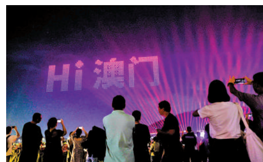
▲本屆橫琴天沐河水舞光影秀融入諸多澳門元素。

第二屆橫琴天沐河水舞光影秀從9月28日持續至10月3日晚，在橫琴天沐河賽艇公園精彩上演。1000平方米的水上屏幕、30米高的智慧水幕，融合3D裸眼動畫、激光表演等技術，依次展現琴澳花海長廊、相思瀑布等兩地元素，表達兩地攜手共贏、共度佳節的願景。本屆活動不僅包含水上光影的精彩演繹，更融合千架無人機表演。