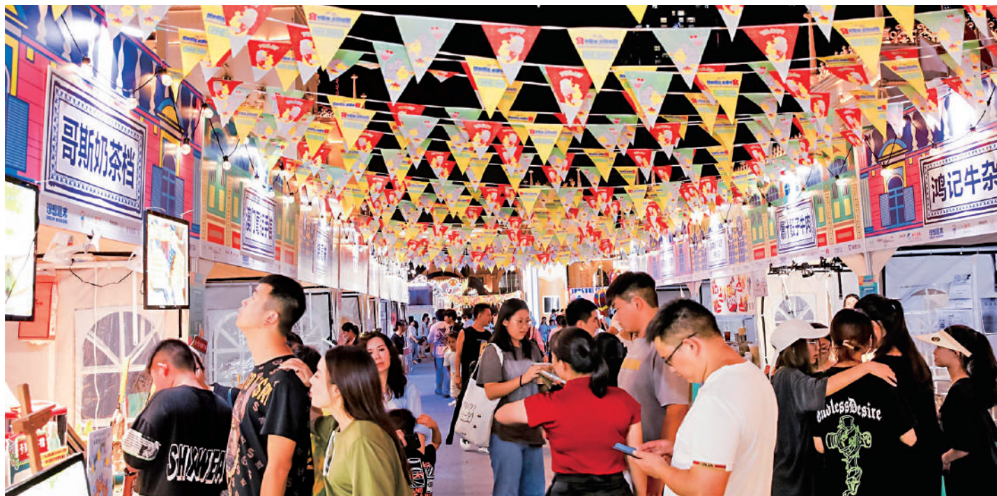
▲澳門國際文化美食節「橫琴站」吸引粵港澳等眾多遊客享口福。

也有業界專家指出，由琴澳美食節遷延至中秋節、國慶節「一節兩地」，從跨境「美食休閒遊」到「一程多站」多樣化旅遊線路，進一步促進粵港澳大灣區區域旅遊聯動發展，亦成為灣區共建「宜居宜業宜遊」優質生活圈的鮮活動力。