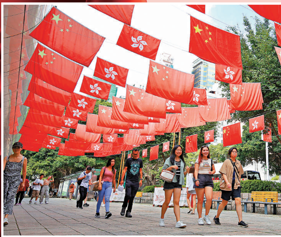
香港各區國旗和區旗飄揚，國慶節喜氣洋洋。