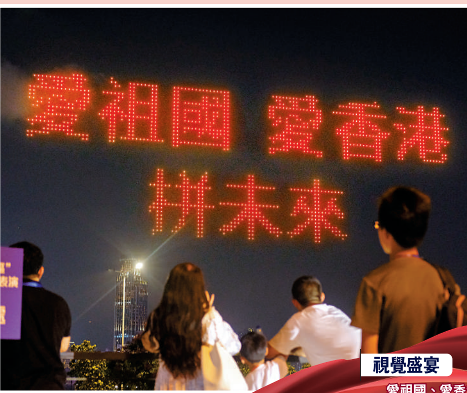
無人機表演首次在香港與深圳雙城聯飛，點亮兩地夜空。