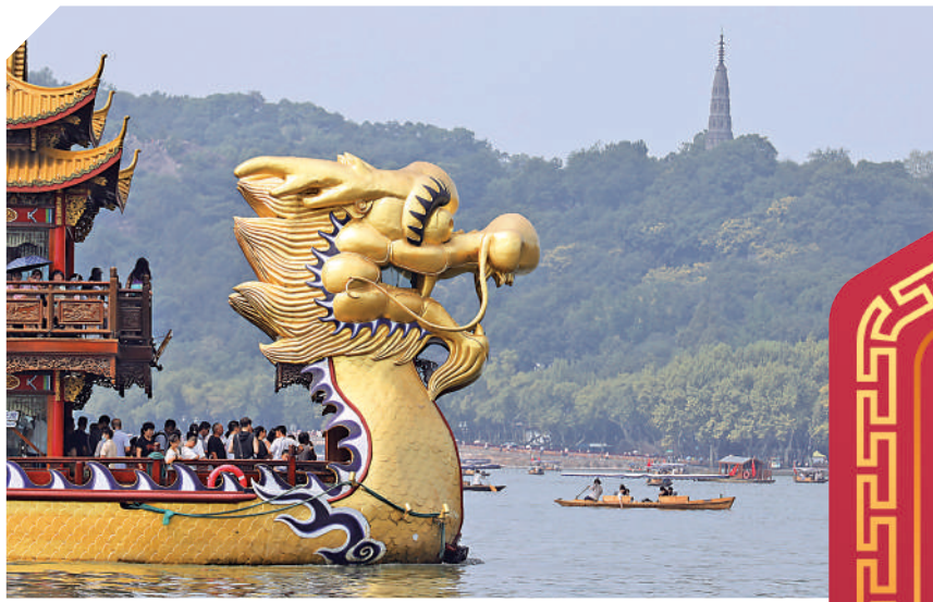
◀9月29日，遊客乘船在杭州西湖遊覽。