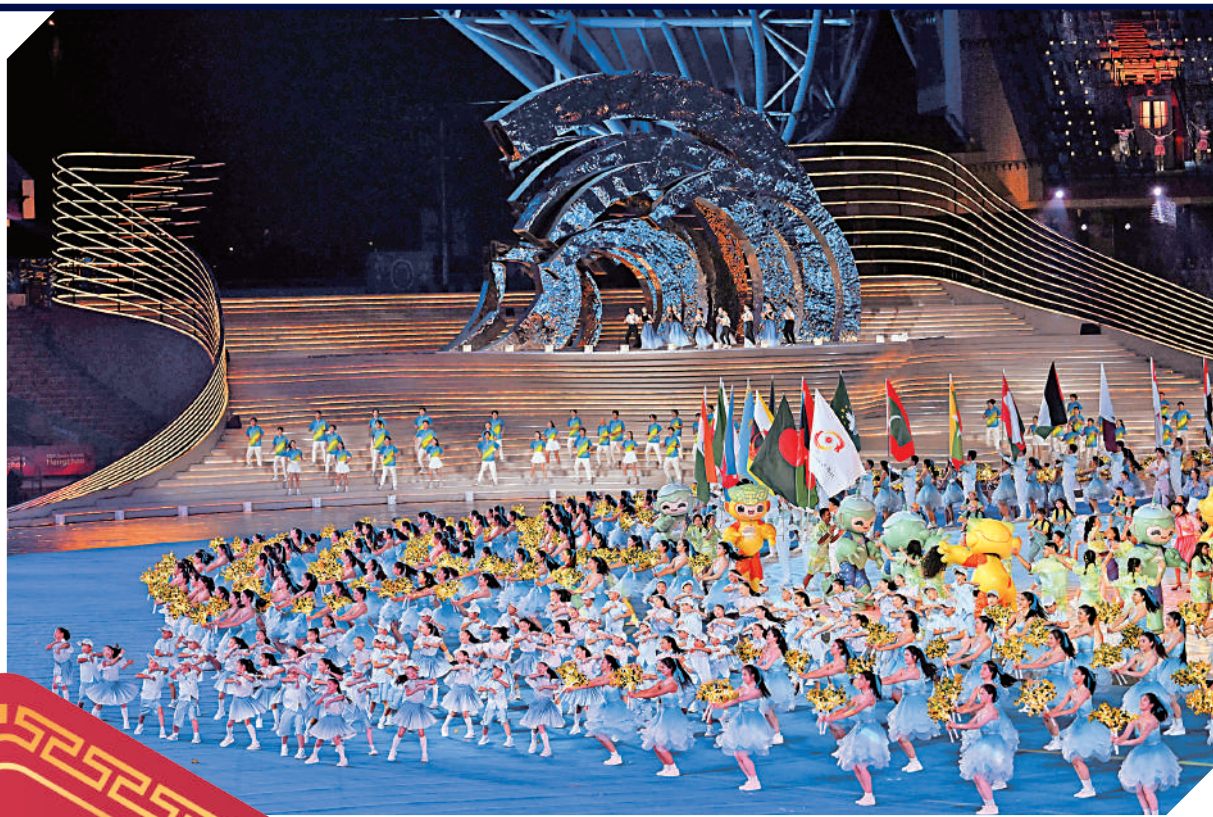
▲杭州亞運會開幕式上的表演精彩紛呈。