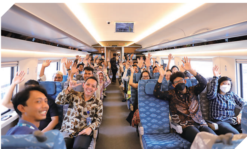
▲9月8日，中國和印尼的建設者體驗雅萬高鐵。