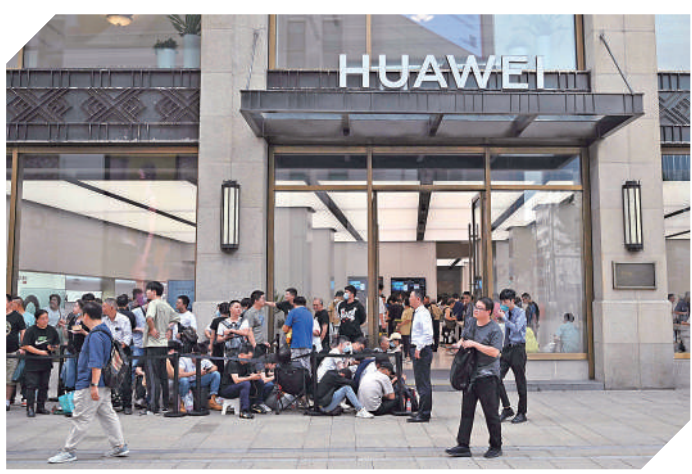
外排隊。 9月25日，大批顧客在上海華為旗艦店。