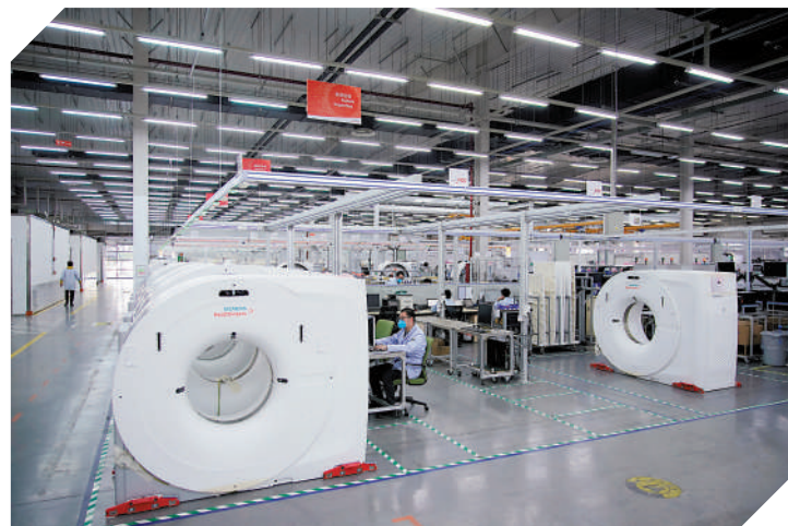
◀位於上海的西門子醫療設備生產車間。