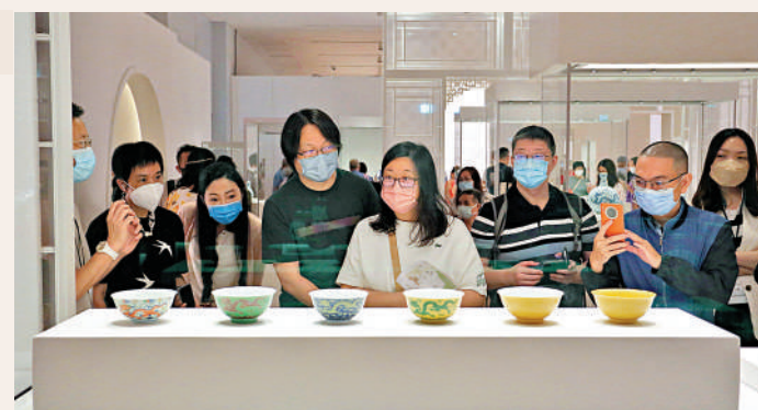
▲香港故宮文化博物館昨日錄得超過9200人次入場創新高。