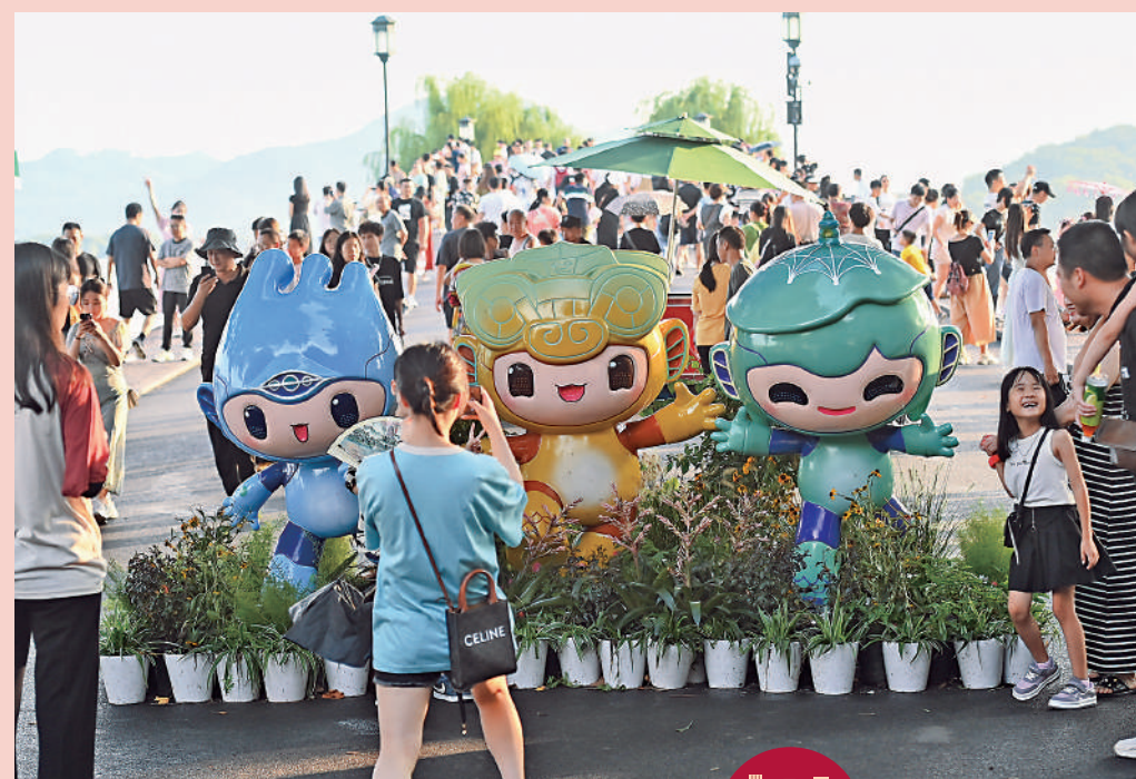
▲黃金周假期遇上亞運會，杭州旅遊火熱。圖為遊客在杭州西湖景區的斷橋邊與杭州亞運會吉祥物合影。