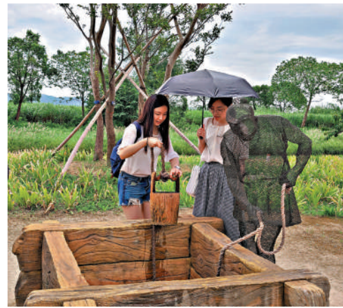
▲遊客在良渚古城體驗從木製水井中打水。

杭州亞運會吉祥物宸宸、琮琤、蓮蓮分別代表着杭州京杭大運河、良渚古城遺址以及西湖三大世界文化遺產。跟着三隻吉祥物去千年古運河邊「走運河，行大運」，跨過「宸宸」的原型拱宸橋，進入橋西歷史文化街區，感受老杭州愜意的市井生活。前往實證中華五千年文明的良渚，在良渚博物館裏可以尋找到「琮琤」頭頂的文物「玉琮」，到良渚古城遺址公園亞運聖火採集廣場，共沐中華文明之光。夜西湖華燈初上，走在略帶朦朧感的西湖邊，觀看盛大的音樂噴泉，也會別有一番味道。