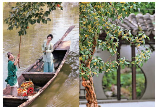
▲滿隴桂雨景區的桂花盛開（右），遊客泛舟西溪摘火柿（左）。

「十一」黃金周正值杭州最有「味道」的季節，滿城桂花飄香。走進新西湖十景之一的滿隴桂雨，瞬間就能被桂花的甜香湮沒，一陣微風吹過，便下起了金黃色的桂花雨。泡一杯西湖龍井，配幾塊桂花糕點，慵懶地坐在桂花樹下，花瓣飄入杯中，一杯桂花龍井自然天成。屬於杭州秋日的浪漫還有那西溪濕地掛滿枝頭的燈籠火柿。乘一艘小舟，在濕地水系間緩緩前行，白鷺從眼前飛過，鸞鷖伴着小舟同行，人與自然在這一時刻完美融合。水系兩岸的柿子樹已經結果壓枝，就像一個個小紅燈籠，伸手可摘。