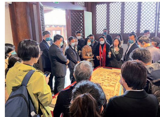
▲遊客在德壽宮參觀。

杭州作為南宋都城，達到了古代城市發展史上的頂峰。歷經千年，氣象萬千的宋文化仍在杭城的各個角落吐納呼吸，宋韻也成為杭州的一張「金名片」。小到一片傳承千年的茶葉，大到一座皇家宮殿遺址保護，千年宋韻文化在杭州傳承至今，依然迸發出強大生命力。想要穿越千年時空，親歷宋韻風華的遊客，可以選擇這條路線：德壽宮—鼓樓—南宋御街—大井巷—胡慶餘堂—江南銅屋—城隍閣—杭州書房（南宋書房）—西湖琴社—南宋官窯博物館。相信走完全程，你會讀懂千年宋韻，也會更流連於人文杭州。