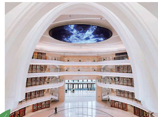
▲之江文化中心內的圖書館。

杭州國家版本館以及新晉頂流之江文化中心成為文藝青年打卡之地，這裏不僅好玩好看，而且建築極具美感，可以360度拍出美照。走進館內，如同置身於中國宋代山水畫中，曲面屋頂，青瓷屏風，亭台樓閣，園景互融，隨手一拍便是大片。館藏各類版本累計100萬冊（件），還設有數字展廳，以「數字版本+沉浸多媒體空間」的形式展現中華版本內涵。之江文化中心是浙江省內體量最大，集自然、人文、藝術、生態於一體的現代複合文化綜合體。正在展出的「蔚為大觀——全省博物館百大鎮館之寶特展」更是引流無數。