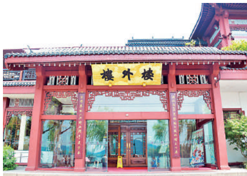
▲杭州百年老字號酒樓——樓外樓。 的宋嫂魚羹、清湯魚圓、知味小籠都是必嘗的特色杭幫菜。

網傳杭州是「美食荒漠」，建議初到杭州的遊客，去老字號酒樓親自嘗一下正宗杭幫菜之後，再做判斷。杭幫菜分為「湖上」、「城廂」兩個流派。前者用料以魚蝦和禽類為主，擅長生炒、清燉、嫩溜等技法，講究清、鮮、脆、嫩的口味，注重保留原汁原味。後者用料以肉類居多。杭幫菜的口味以鹹為主，略有甜頭。「清淡」是杭幫菜的一個象徵性特點。百年老字號樓外樓的西湖醋魚、東坡肉、西湖莼菜湯，杭州酒家的叫化雞、龍井蝦仁、乾炸響鈴以及知味觀