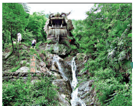
▲在山溝溝景區，遊客享受自然美景。

如果厭倦了快節奏的都市生活，不如趁着假期，於山水田園處、阡陌村莊裏，優哉游哉度過一段擁有治癒魔力的慢時光。距離杭州市區一小時交通圈內，遍布綠水青山、鄉野樂趣的景點。徑山景區和山溝溝景區同屬天目山脈，高聳入雲、連綿起伏的山峰翠竹，呼吸一口新鮮空氣，都會覺得神清氣爽。千年古剎徑山寺就隱藏其中。在鷓鴣房區，這裏有杭州地區首個以房車為特色的戶外露營基地，還有山地越野、滑翔傘、漂流等多種戶外運動休閒項目，喜歡運動冒險的遊客可以一試。