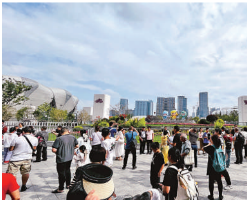
▲10月1日，遊客來到杭州奧體中心外拍照留念。

杭州亞運會賽事雖已過半，但像羽毛球、排球、田徑、舉重等精彩項目還在繼續。面對很多熱門場次「一票難求」的狀況，杭州亞組委也已正式回應，通過多種方式進行票務優化，已向公眾額外釋放42個分項的近30萬張門票。因此，假期搶到門票，到場觀賽沉浸式感受亞運氣氛的可能性大大增強。建議可更多關注杭州奧體中心體育場、體育館以及游泳館賽事門票，因為這三大場館相距甚近，一張門票就可實現「特種兵」式巡遊三大場館的願望。