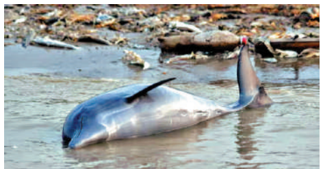
▲大量河豚的屍體漂浮在特費湖上。 網絡圖片

【大公報訊】據《衛報》報道：巴西亞馬遜地區正經歷歷史性乾旱，部分水域溫度甚至超過39°C，附近亞馬遜河流域的特費湖過去一周驚傳逾百隻瀕危物種