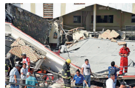
▲墨西哥聖克魯斯教堂1日發生屋頂坍塌事故。

當地記者孔特雷拉斯表示，當人們排着隊接受聖餐時，屋頂坍塌壓在人們身上，磚塊、混凝土以及鋼筋都掉了下來。據紅十字會官員稱，教堂長椅與破碎的磚