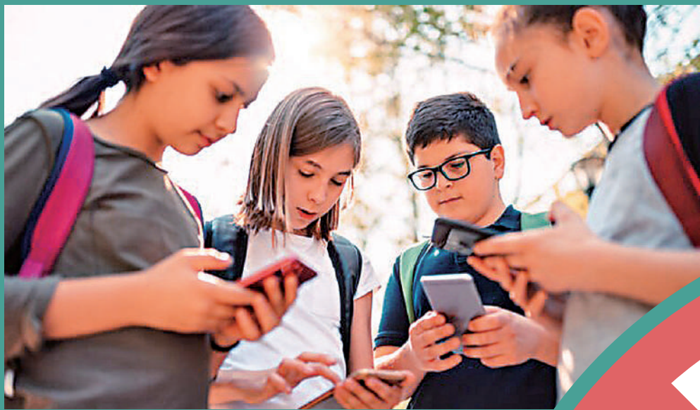
▲英國擬下令禁止學生在上課和休息期間用手機。

【大公報訊】綜合BBC、《每日郵報》及《華盛頓郵報》報道：英國教育部長吉莉安·基岡2日宣布，英格蘭學校必須禁止學生在上課及課間休息期間使用智能手機，以提高學生的注意力，且減少盜竊和網絡欺凌現象。聯合國此前發布報告指出，建議禁止學生在校園內使用智能手機。