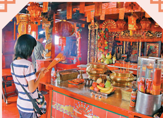
▲善信乘駁船到水上天后廟參拜。