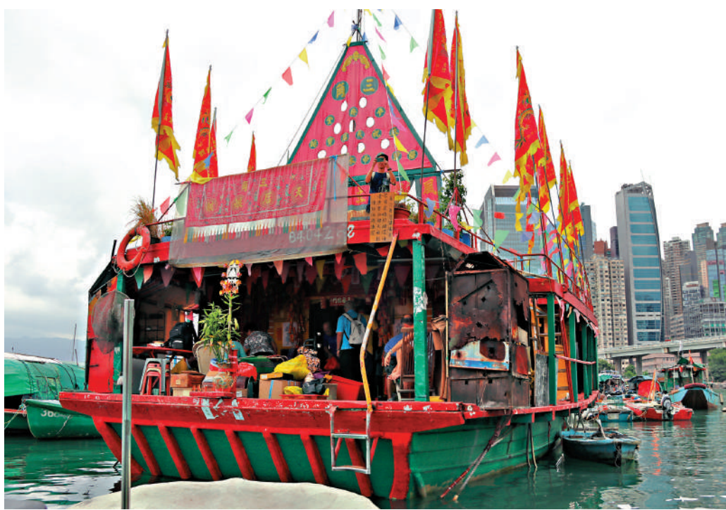
▲銅鑼灣避風塘內，有68年歷史、全港唯一的水上天后廟，今日搬遷「上岸」。