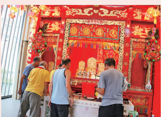
▲新廟宇已準備就緒，今日迎接天后娘娘上位。