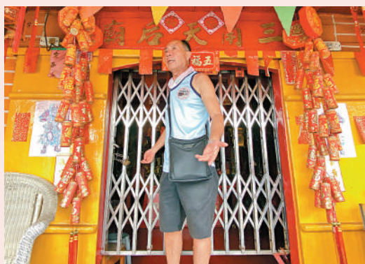
▲負責人好叔完成最後一次膜拜後，把水上天后廟的鐵閘關上。