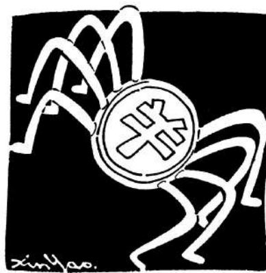
人有兩隻腳，錢生八隻腳。