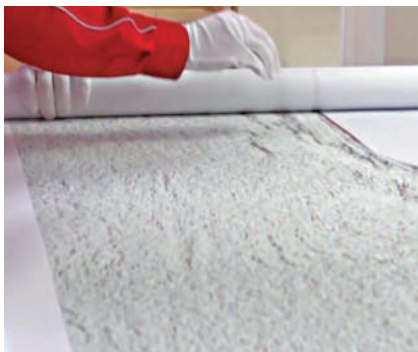
▲專家正解釋此次測繪的3000米深水地質勘探圖。