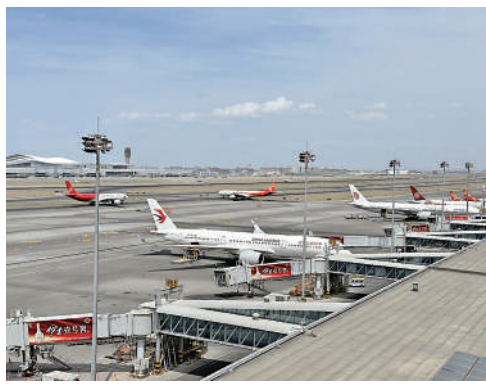
▲烏魯木齊機場航班繁忙。