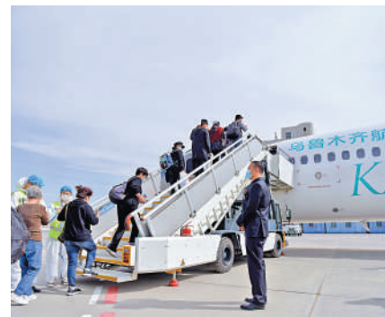
▲6月23日起，烏魯木齊航空開通烏魯木齊經蘭州往返香港航線。