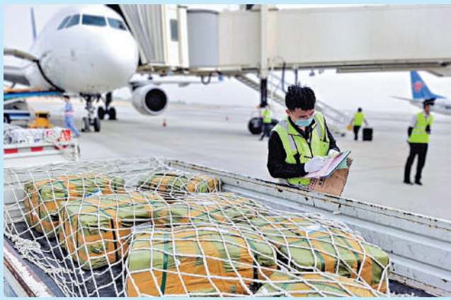
▲烏魯木齊機場客貨並舉，打造聯通亞歐國際航空樞紐。