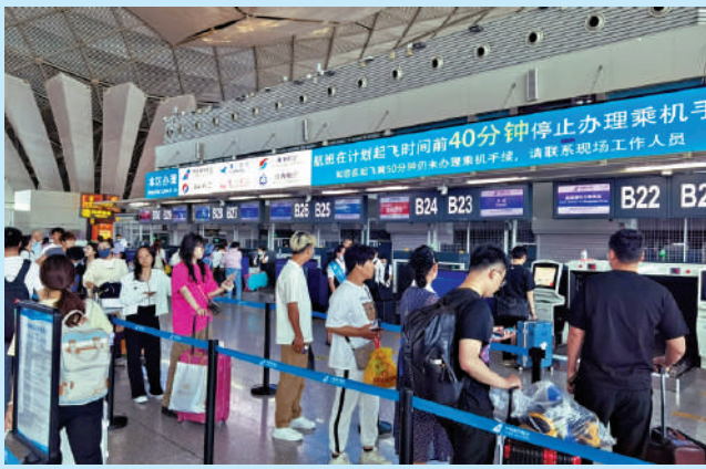
▲旅客在烏魯木齊機場航站樓內等待安檢。