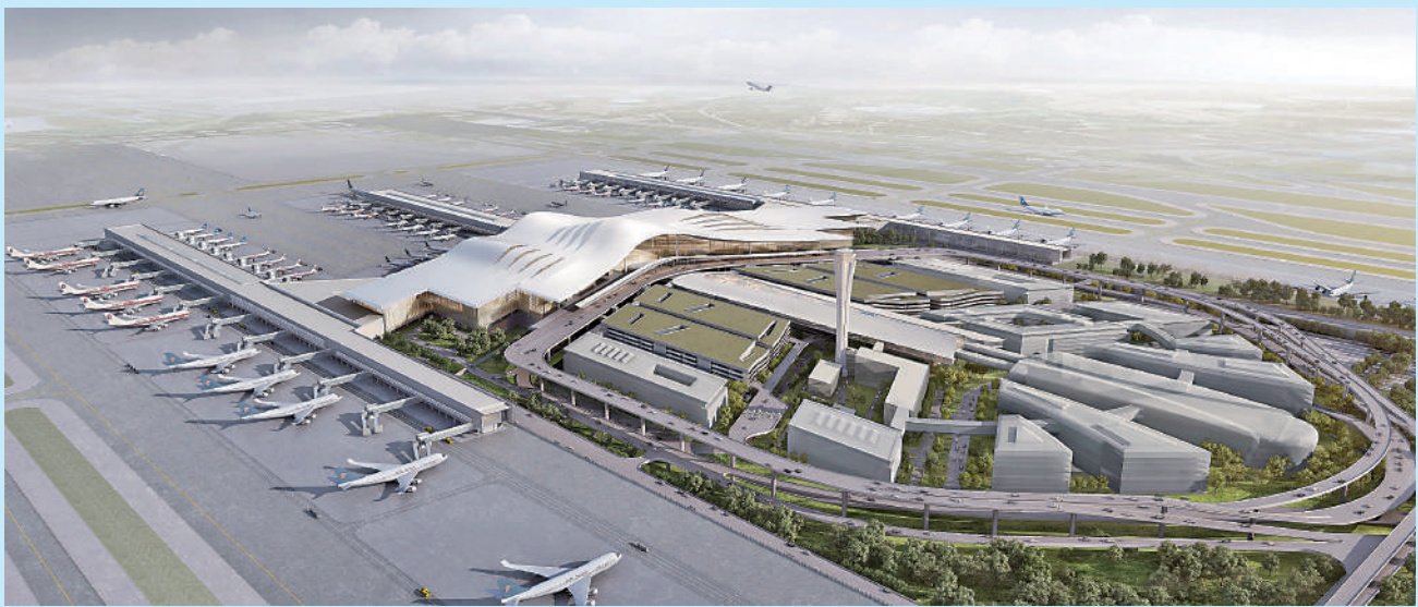
▲烏魯木齊機場改擴建工程項目效果圖。