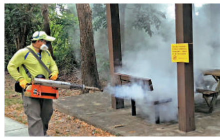
▲為防止登革熱疫情擴散，島內相關部門採取噴藥等緊急防治措施。

【大公報訊】據中通社報道：台灣登革熱本土疫情延燒，當局「疾管署」3日通報，9月26日至10月2日新增2542