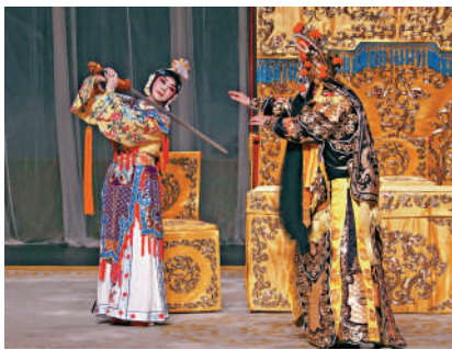
▲大陸京劇院演員在台北演出《霸王別姬》。新華社

【大公報訊】據新華社報道：「台上的角兒個個聲如洪鐘，新鶯出谷，扮相極美，演出行雲流水，將台灣觀眾帶入京劇藝術的美好境界。」「叫好叫到嗓子啞了，鼓掌也把手拍