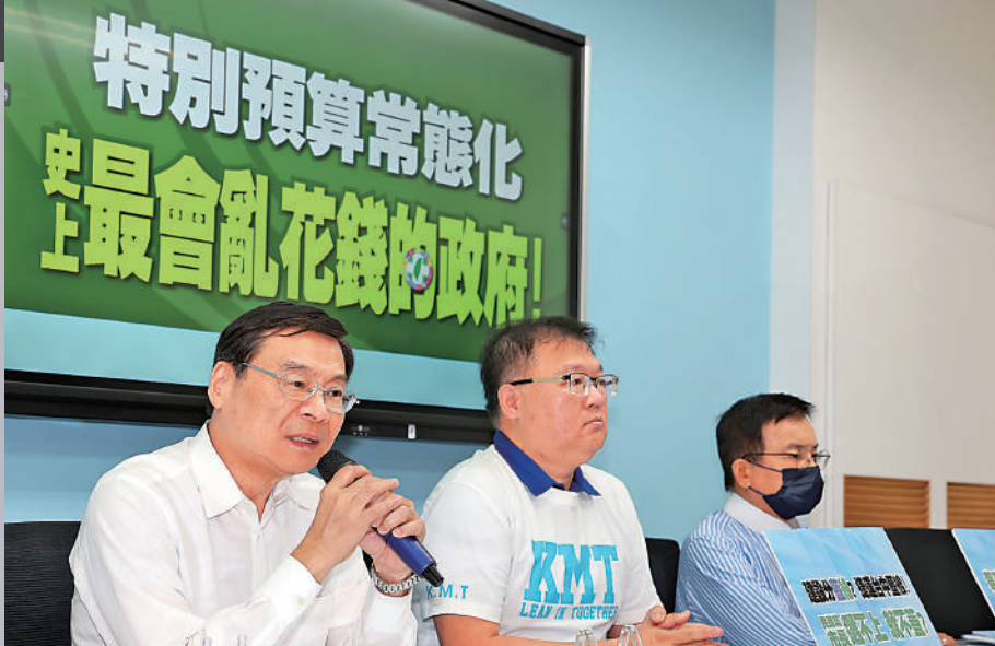
▲國民黨舉行記者會，批評民進黨當局濫用公帑，浪費民脂民膏。