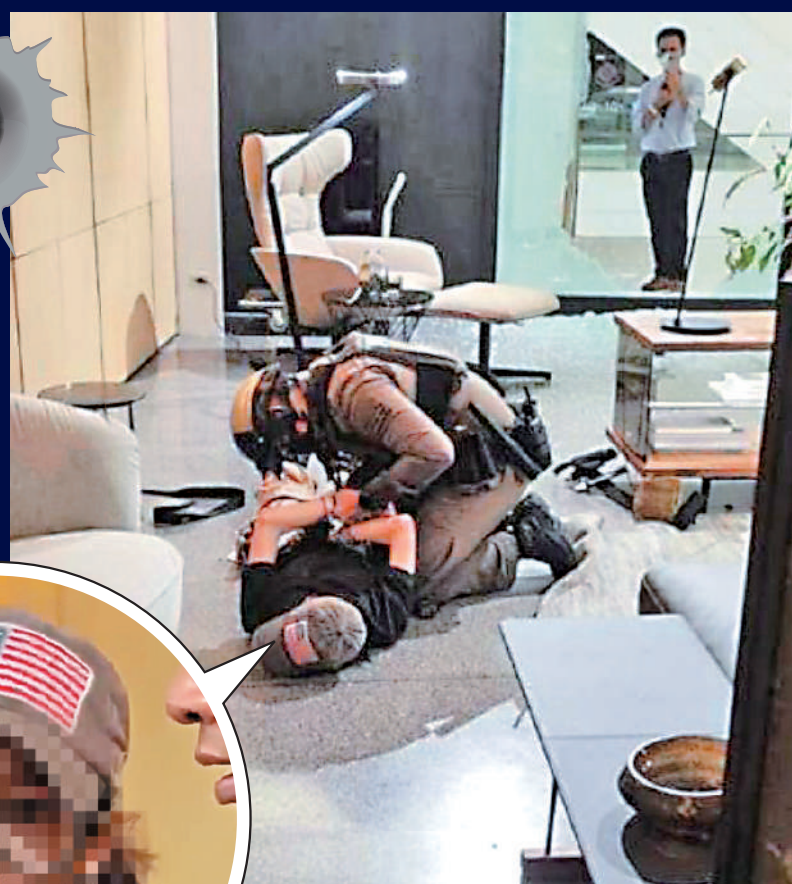
◀◀ 14歲槍手被捕，槍手戴有一頂美國國旗圖案的棒球帽。