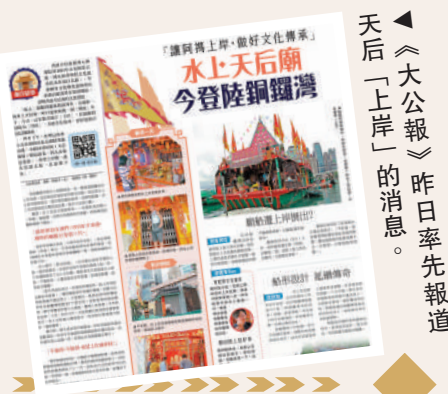
▲《大公報》昨日率先報導天后「上岸」的消息。掃一掃 有片睇