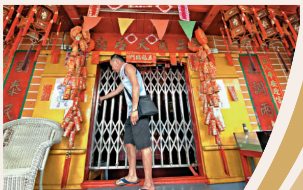
▲負責打理水上天后廟的工作人員，日前完成在水上的最後一天膜拜，鎖上閘門。