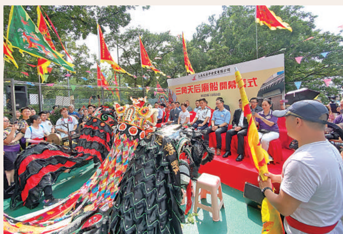
▲全港唯一水上天后廟昨日在銅鑼灣消防局「登陸」，新廟舉行「三角天后廟開幕儀式」。