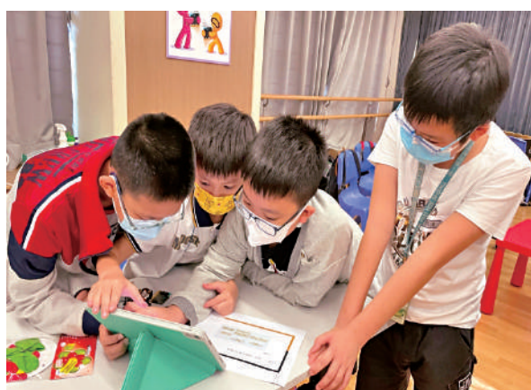
▲小學生近年使用電子屏幕產品的時間愈來愈多，令視力有所下降。