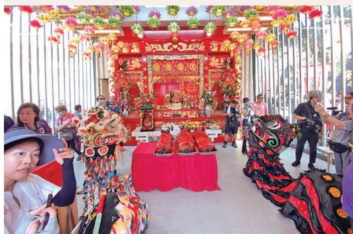
▲新建的天后廟仿照原來廟船的設計布局，配合中國傳統木構建築藝術，展現香港中西文化匯聚的特色。