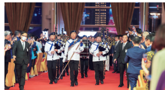
▲主禮嘉賓入場時由警察樂隊伴奏，場面盛大。

今年的國慶煙花亦首次使用航拍並配合5G技術進行拍攝，市民即使未能親臨維港兩岸，亦能夠透過Now TV及ViuTV體驗一種嶄新的賞景角度。香港電訊介紹，本次共安排了四部航拍機，分別於距離地面約100米及300米的高度近距離拍攝煙花匯演，務求令坐在電視機旁的觀眾亦能感受前所未有的視覺震撼。