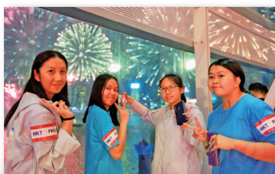
▲晚會特別邀請了超過60位「共創明『Teen』計劃」的學員，一起分享國慶喜悅。