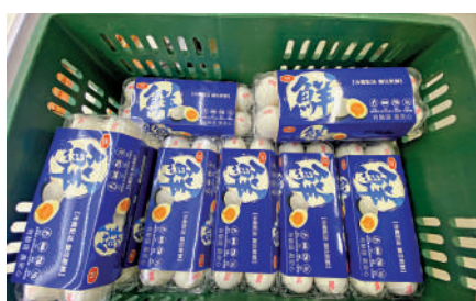
台當局進口過量雞蛋，導致大批雞蛋將過期。

最新雞蛋產銷信息，目前島內每日約有3368萬隻雞蛋投入生產，雞蛋每日生產量維持11.7萬箱（每箱約200顆），距離台灣民眾每日需求量12萬箱，仍有約60萬顆供應缺口。