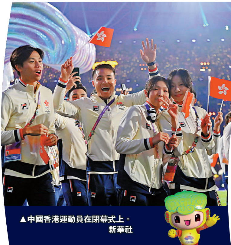
▲中國香港運動員在閉幕式上。