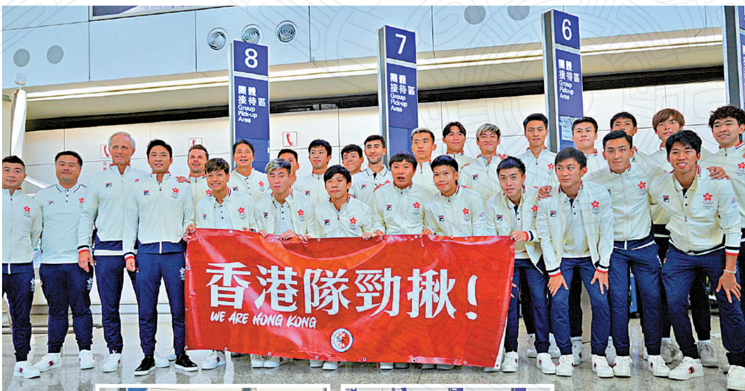
港足完成亞運後昨日返港。