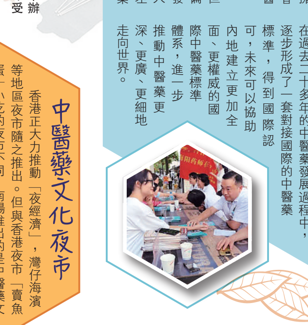
▲中醫藥文化夜市，舉辦中醫藥辨識等活動，深受歡迎。

對人才的要求越來越高，特別在技術含量很高的醫藥研發領域，高級專業技術人才和專業的複合型人才有一定的需求缺口，一定程度上制約了內地醫藥製造行業的發展。香港基礎科研能力突出，近年大力發展創科中心，中醫藥科研也取得了顯著進展，在人才培養等方面可以為香港提供助力。