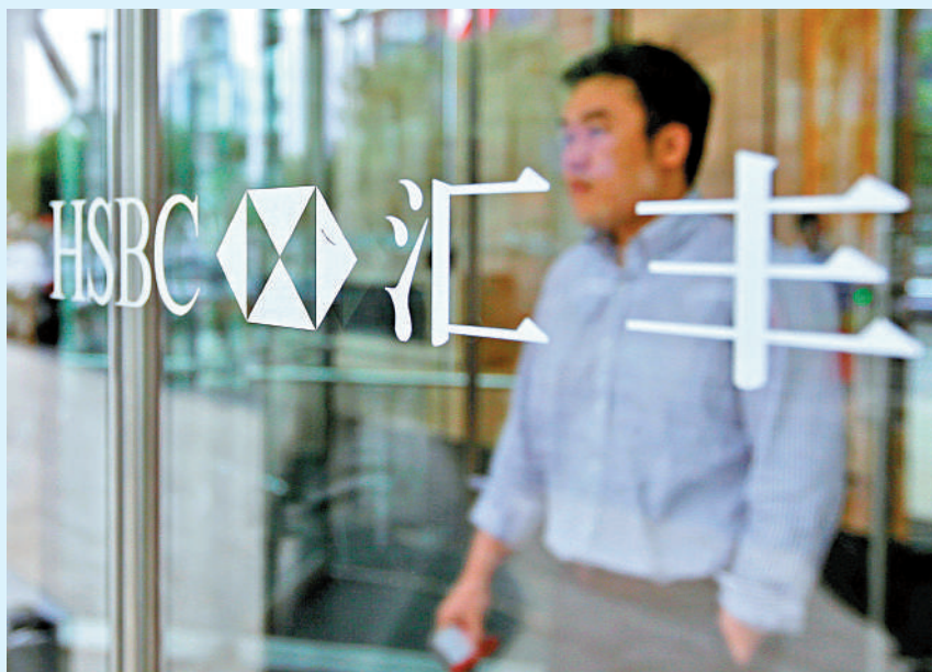
▲滙豐表示，今次收購行動印證集團立足長遠、深耕中國市場的堅定承諾。

滙豐進一步拓展集團在中國內地的個人財富管理業務。集團旗下的滙豐銀行（中國）昨日宣布與花旗銀行（中國）達成協議，將收購花旗在中國內地的個人財富管理業務，覆蓋花旗中國在內地11個主要城市的個人財富管理客戶的投資理財資產及個人存款，總值約為36億美元（截至2023年8月，折算約280.8億港元）。