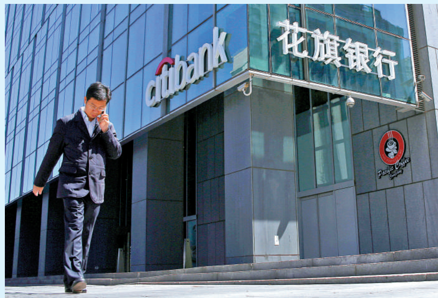
▲花旗指相關交易條款並未公開，預計明年上半年完成交易。