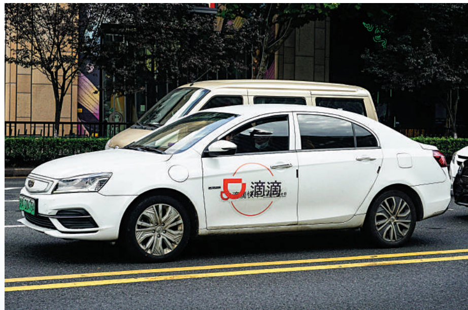
▲滴滴據報計劃向員工回購股份。分析認為，此舉是為來港申請上市鋪路。