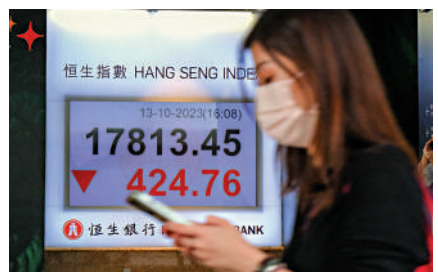
▲恒指昨日跌424點，全周則累升328點。

浙商證券亦指，內地穩增長政策持續發力，經濟探底企穩回升。9月PMI（採購經理指數）回升至榮枯線以上，製造業景氣度連續4個月回升，供給修復強於需求，需求連續兩月好轉，穩增長政策刺激下後續將保持一定韌性。地產政策「組合拳」頻出，中上游需求或將回暖，企業盈利預期將逐步改善，港股盈利中樞有望抬升。四季度以困境反轉策略為主，首先短期海外流動性邊際改善，關注港股成長風格，如科指，互聯網、醫藥、汽車、有色金屬板塊；其次，關注中美關係相關受益板塊，如半導體、新能源板塊；最後，中長期關注內地經濟穩增長，繼續擁抱紅利及供給端受限相關板塊，如通信運營商、石化、公共事業板塊，邊際關注油服、船舶。