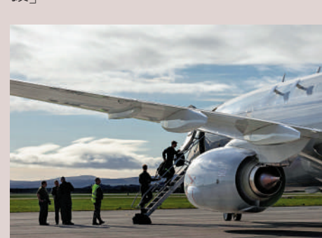
英軍士兵登上P8「海神」偵察機，準備前往地中海。