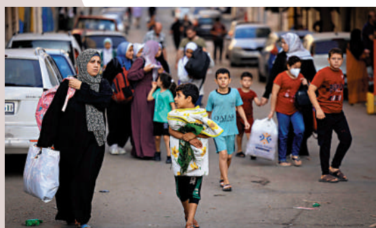
加沙民眾13日逃往更安全區域。