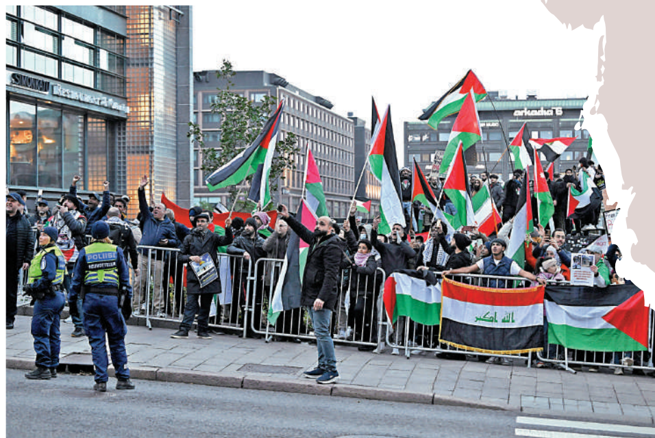
大批民眾13日在以色列駐芬蘭大使館外示威，聲援巴勒斯坦。

嫌犯曾是該校學生，此前已被列在「構成潛在安全風險人員」名單上。警方稱，兇徒來自車臣。