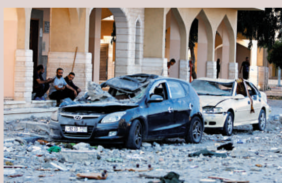
以色列空襲後，加沙南部多地淪為廢墟。