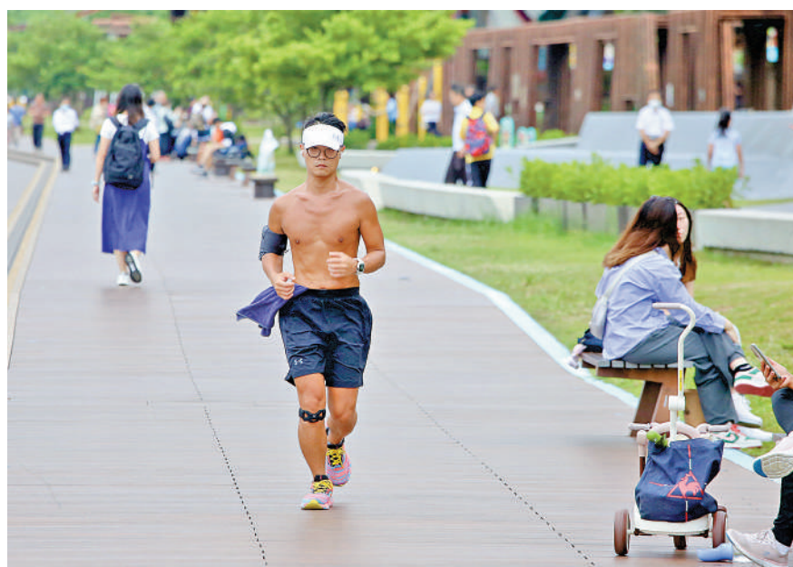
▲昨日天氣仍然炎熱，但隨着一道冷鋒在下周抵達，本港氣溫將下降。