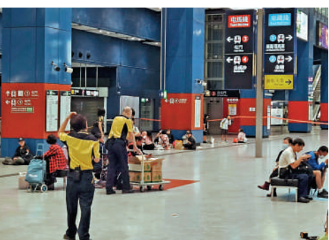
▲過去的星期日颱風「小犬」襲港，九號風球下港鐵部分路段停駛，大批市民滯留港鐵站。

林世雄指出，「小犬」襲港當日天氣急速轉壞，天文台要在短時間內發出九號風球，以致旅客滯留機場。香港作為國際航空樞紐，在風暴期間亦會盡量讓航班繼續升降，以減少滯留外地的港人，以及在港等候轉機的乘客。