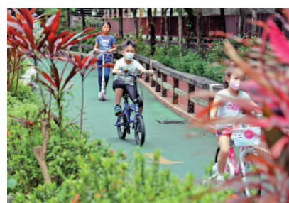
▲有研究顯示，學童的體能活動量在疫後雖然顯著回升，但仍未達世衛標準。

過去一年，中小學生在上課日平均每日做約28分鐘運動，比疫情期間多9分鐘，惟只有8%學童達到世衛