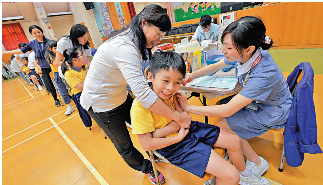
▲應對冬季流感和新冠病毒雙重夾擊，專家呼籲高危險群組盡快接種疫苗。

衛生防護中心數據顯示，本港於8月中進入夏季流感季節，截至10月7日，錄得214宗成人確診流感重症個案，當中129人死亡，另有13宗兒童流感嚴重個案，當中一人死亡。在昨日的立法會衛生事務委員會會議上，醫務局局長盧寵茂表示，監測數據顯示，季節性流感的整體活躍度不斷上升，流感病毒在呼吸道樣本的陽性比率，截至10月7日的過去一星期內，上升至13.28%，遠高於9.21%的基線水平。