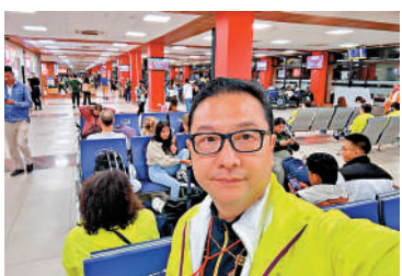
▲李先生斥民主黨區議員在黑暴期間未為居民做好服務。