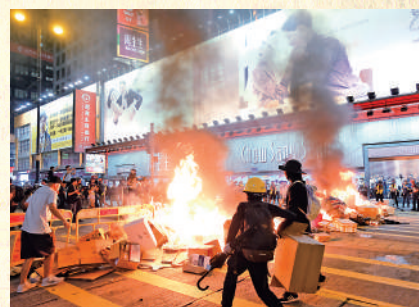
▲民主黨多名頭目公然支持黑暴，蛇鼠一窩。