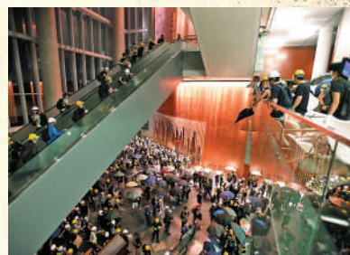
▲許智峯公然與闖入立法會暴徒同行，最終潛逃。

2019年7月6日，黑暴分子搞出所謂「光復屯門公園」遊行，民主黨前立法會議員林卓廷、許智峯等在屯門警署外要求一名市民刪除暴徒的照片，其後事主更遭暴徒襲擊。有關案件經審訊後，區域法院法官裁定林卓廷妨礙司法公正罪脫，已棄保潛逃的許智峯則被法庭頒下拘捕令。