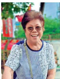
▲謝女士希望未來的區議員實實在在為服務街坊。