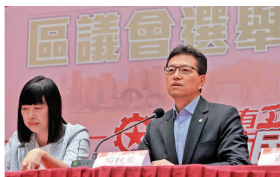
▲工聯會宣布派出46人參選區議會選舉。

企圖奪取政權的平台，他們將「港獨」、分離主義思潮帶入地方行政架構。他表示，改革後的區議會堵塞了危害國家安全的漏洞，還社區和諧幸福，讓市民安居樂業。