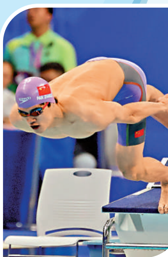
▲潘展樂在杭州亞運打破男子100米自由泳亞洲紀錄。