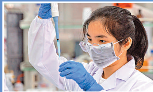
▲中外合資企業員工在灣區內配套的產業園區工作。

▶「泛大灣區外來投資聯絡小組」9月在德國慕尼黑舉辦「粵港澳大灣區—歐洲經貿合作交流會」。