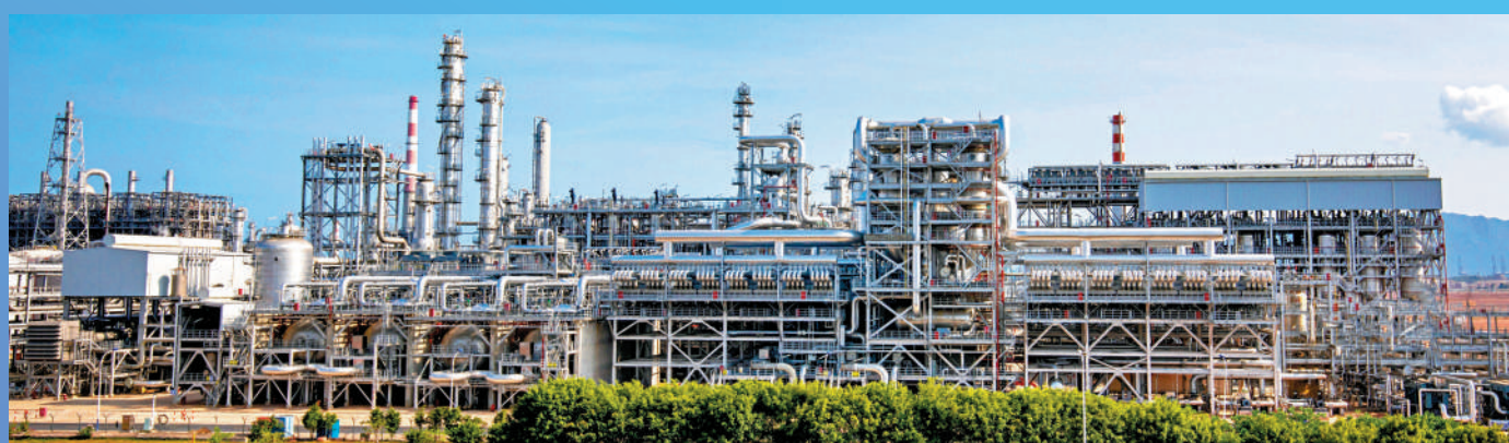
▲灣區近年吸引不少跨國企業落戶。圖為已有埃克森美孚、科萊恩、巴斯夫等石化產業巨頭落戶的惠州大亞灣石化區。