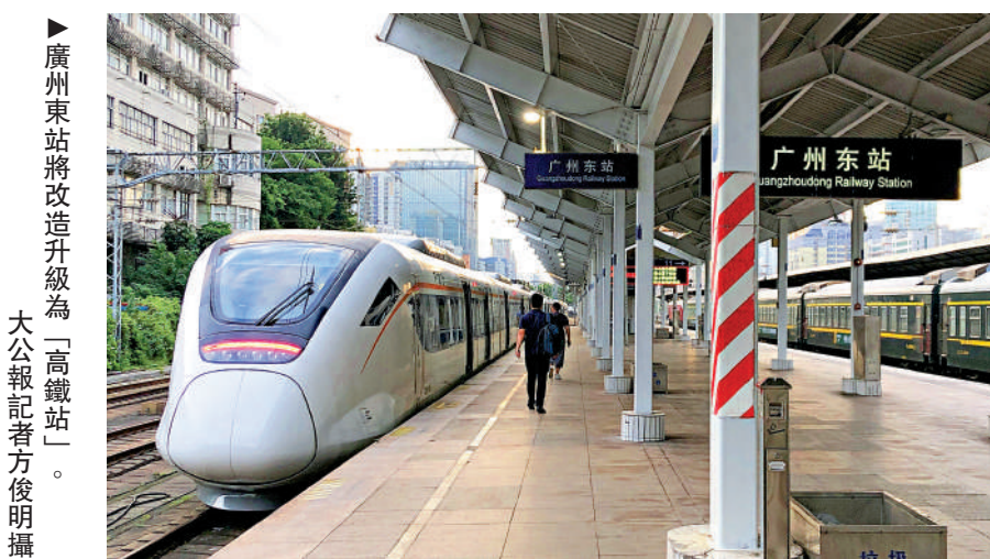
▲廣州東站將改造升級為「高鐵路站」。

航運指數是經濟、航運市場景氣程度的「晴雨表」和「風向標」，該指數的研發有助於海運集裝箱運輸產業鏈企業、外貿企業應對航運價格波動風險和行業周期風險，提升相關企業風險管理水平 and 國際競爭力，有助於促進金融和航運兩個市場的有效連接，提升航運金融服務能級。