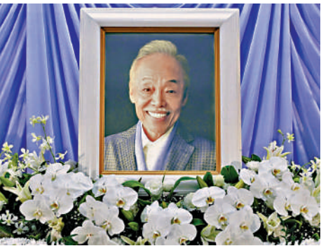
▲事務所昨日發布谷村新司病逝世消息，其葬禮已於10月15日舉行。

谷村新司所屬的事務所昨日（16日）發布消息稱，因患有腸炎，谷村新司於今年3月接受手術治療，此後一直處於療養狀態。10月8日，谷村新司在東京的醫院去世。他的葬禮已於10月15日舉行，只有近親出席。事務所表示，計劃日後專門設立緬懷谷村新司的場所。