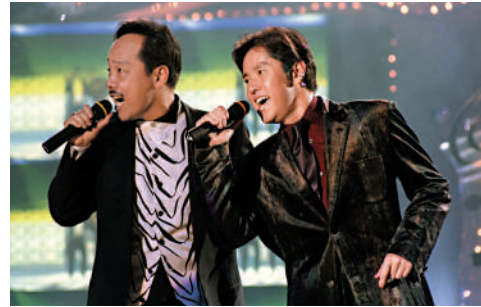
▲谷村新司（左）1996年來港，與獲得港台金針獎的譚詠麟在台上合唱。