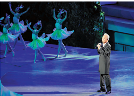
▲谷村新司2010年在上海世博會開幕式演唱歌曲《星》。

谷村新司與香港樂壇關係密切，譚詠麟、張學友、梅艷芳、張國榮、郭富城及黎明等曾改編他的作品。得知谷村新司逝世的消息，譚詠麟在社交平台上寫道：「日本著名歌手兼我好友谷村新司離開我們了！懷念。」