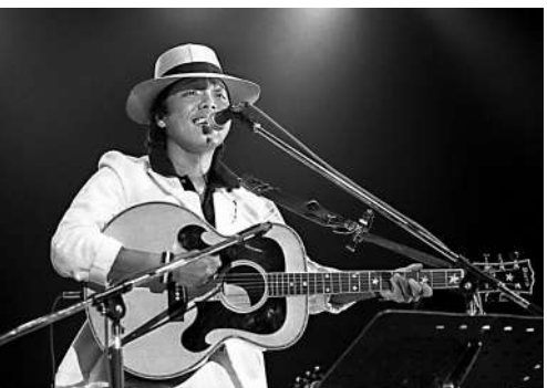
▲1979年，谷村新司在日本武道館演出。