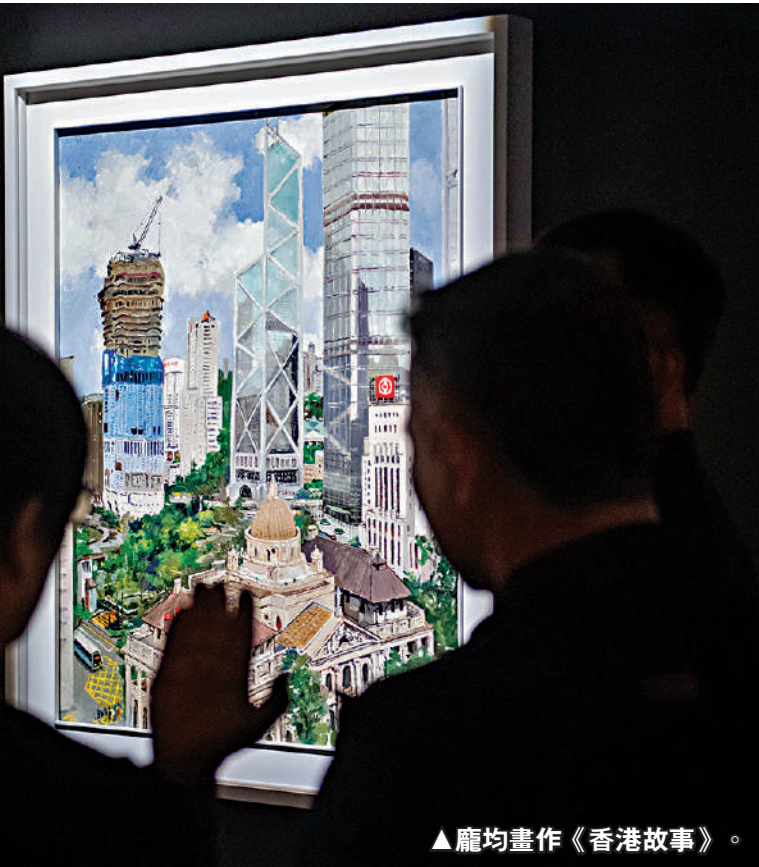
▲龐均畫作《香港故事》。

「龐均老師的作品不但線條細膩，情感真摯，更完美結合了西洋藝術斑斕奔放的色彩與東方藝術含蓄內斂的哲思。」策展人方