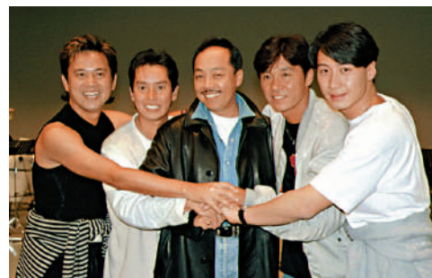
▲谷村新司（中）與不少香港歌手熟絡，左起：陳百祥、譚詠麟、黎明（右一），右二為西城秀樹。