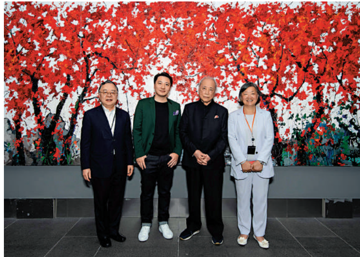
▲眾嘉賓在龐均畫作《花間一壺酒》前合影。

身為油畫家，龐均認真鑽研古典與現代藝術，巧妙地將西方油畫語言融合東方水墨寫意，形成了獨樹一幟的油畫東方風格。他