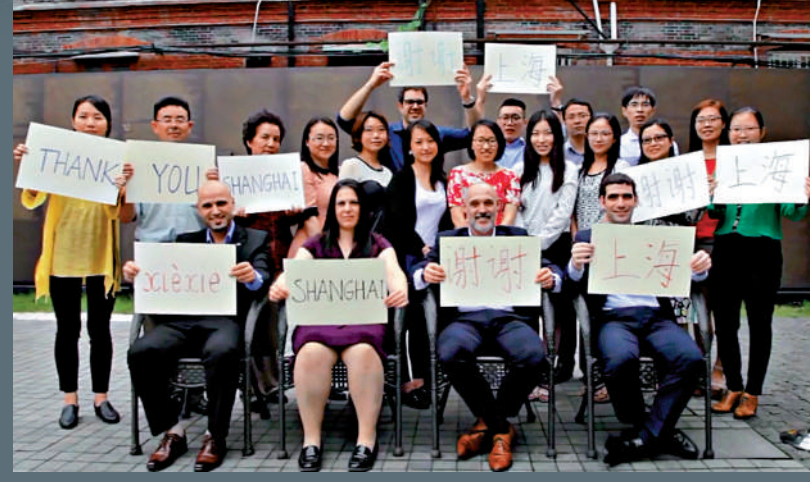
▶2015年，以色列拍攝公益宣傳片《謝謝上海》。視頻截圖