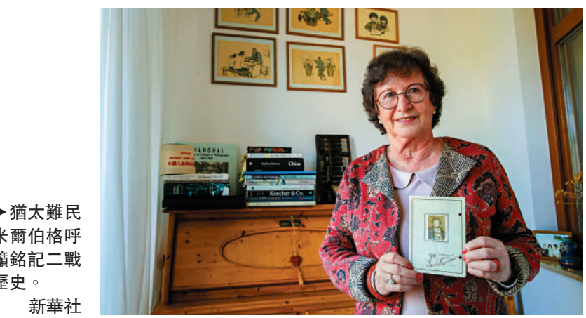
▶猶太難民米爾伯格呼籲銘記二戰歷史。