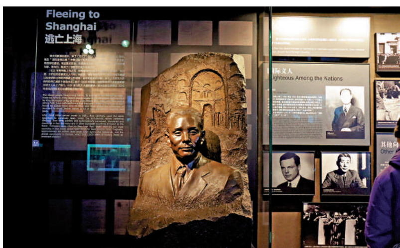
▶上海猶太難民紀念館內陳列何鳳山的塑像。

何鳳山在世時很少宣揚自己拯救猶太人的故事。他於1997年去世後，這段歷史才逐漸浮出水面。2000年7月，以色列政府授予何鳳山「國際正義人士」的稱號。2001年，以色列在耶路撒冷為何鳳山建立紀念碑。