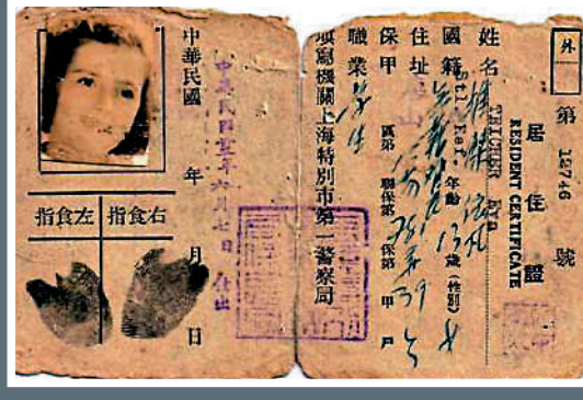
▲一名猶太女孩得到上海警局頒發的居住證。資料圖片