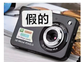
▲有網民貼出用行車記錄儀改裝成CCD相機的圖片，呼籲大家慎防受騙。

有網友總結了用行車記錄儀改裝的CCD相機的特點，如：開機會有「welcome」的字樣，鏡頭中間有紅點，鏡頭不能伸縮等。