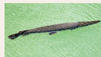
◀啟德河出現的「福鱷」。

啟德河出現一米長怪魚？近日有網民發現，啟德河附近附近的啟德河，竟然出現一條怪魚，外形有點似鱷魚，橄欖色呈菱形的硬鱗，狀甚兇猛，不少網民把怪魚圖對比網上資料，懷疑是外來物種的淡水魚「福鱷」。