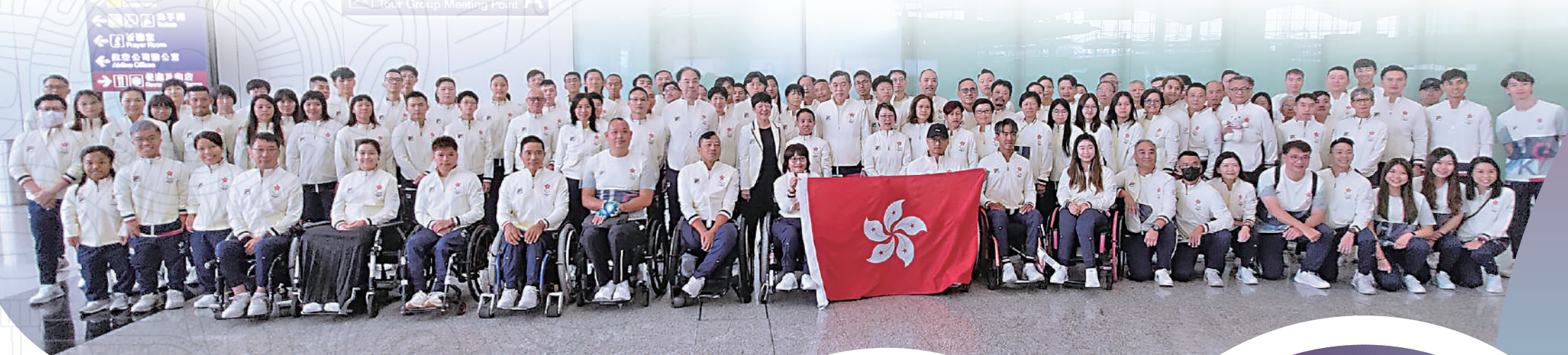
港隊出發到杭州參加亞殘運會。