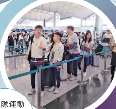
▲港隊運動員在機場等候辦理登機手續。