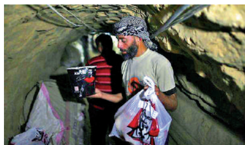
▲外賣人員通過地道將KFC送入加沙內。

過800米的跨境地道送至加沙，加沙的士司機將其從南部邊境運送到外賣公司位於北部的辦公室，最後由摩托車配送餐點。在加