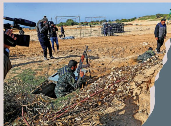
▲哈馬斯在加沙修建了大量的地道，圖為去年哈馬斯媒體部門人員，在地道附近拍攝電視劇。