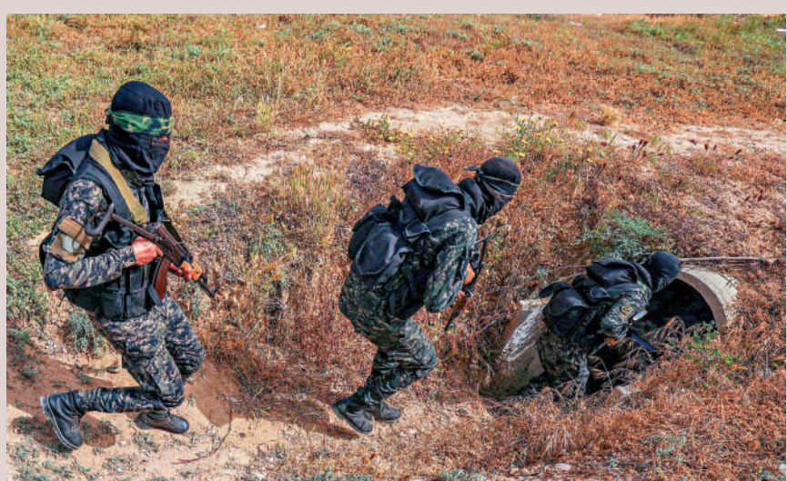
▲2022年4月，巴勒斯坦傑哈德士兵進入加沙地帶的地道。

如果以色列軍隊進入加沙進行地面戰，他們將不得不在陌生環境下，面對錯綜複雜的地道網絡，作戰風險極大。