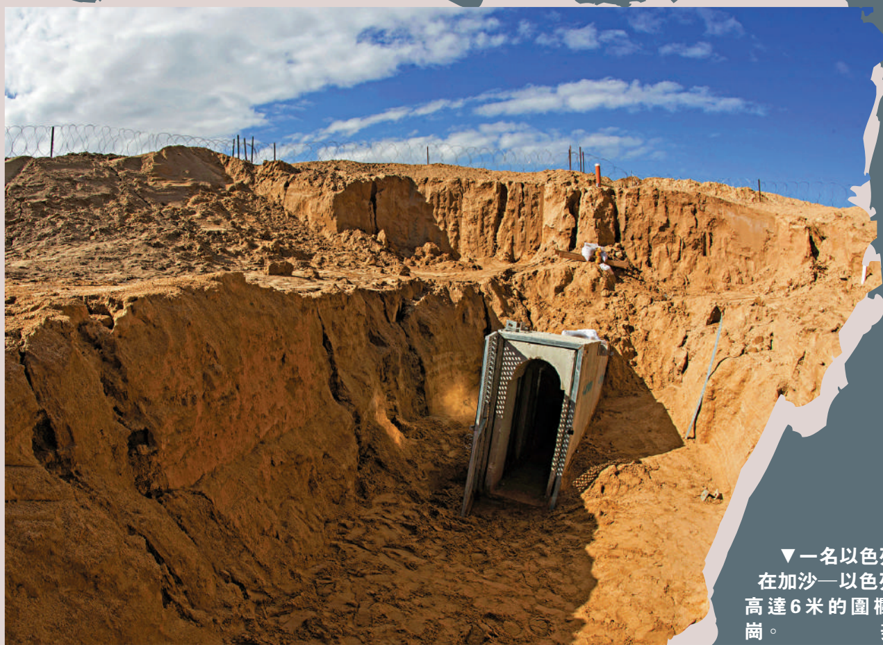
▲以色列基蘇菲姆附近一個從加沙通向以色列的地道出口。