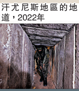
▲一條通向以色列南部境內隧道的內部結構。