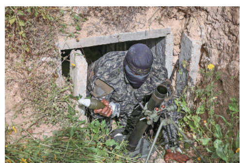
▲2022年4月，一名巴勒斯坦傑哈德士兵在加沙一處隧道出口架設迫擊炮。

動火箭彈，並在主要道路和建築物下方的地道埋設炸彈，以引誘以軍落入陷阱。從防守的角度來講，加沙大多數地道都以混凝土加