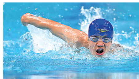
▲中國游泳選手徐海蛟奪得男子200米個人混合泳SM8冠軍。