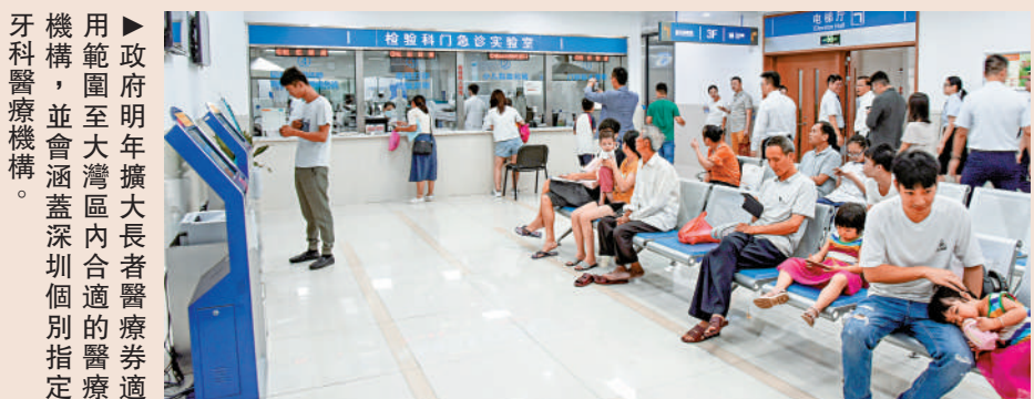
政府明年擴大長者醫療券適用範圍至大灣區內合適的醫療機構，並涵蓋深圳個別指定牙科醫療機構。