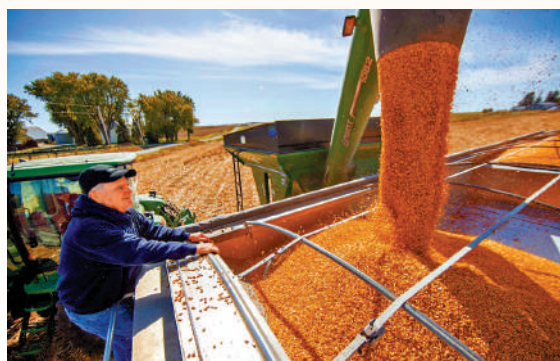
▲美國愛德華州的農民在收成玉米。

該公司在美僱用了近4000名員工，分布在40多個州，每年給員工提供約5.1億美元的工資，購買約20億美元商品和服務，用先進農業技術造福美國農民，拉動當地就業