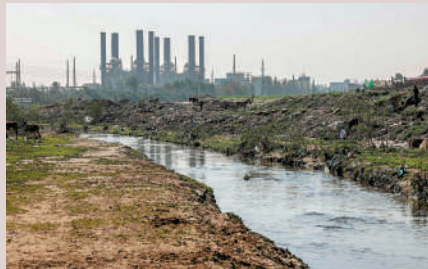
▲加沙地帶中部的加沙河濕地，現時污水橫流。