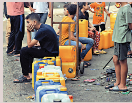
▲加沙居民28日排隊領取淡水。

以色列切斷加沙供水後，聯合國兒童基金會援引巴勒斯坦水資源管理部門的數據稱，目前加沙地帶的生活用水供應量只有平時的5%。目前，加沙平民每人每天可用水僅有3升，遠低於聯合國標準用水量的50升。過去商店貨架上供應的瓶裝水，也因為以色列限制救援物資進入，遲遲不能補充。