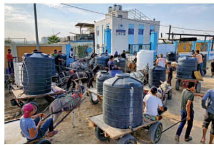
▲巴勒斯坦人27日在加沙地帶中部的一個水站等候領取飲用水。

【大公報訊】以色列長久以來用着多種方法控制着加沙地帶的水源，自新一輪巴以衝突爆發後，以色列切斷了加沙地帶的水、電和燃料供應，目前加沙地區人均每日可用水量僅有3升。隨着清潔的飲用水隨時將耗盡，人們除了飲用被污染的井水或者鹽水之外再無他法，逾200萬的居民面臨着健康風險，而污水可能導致的傳染病，可能會讓當地的人道主義危機雪上加霜。