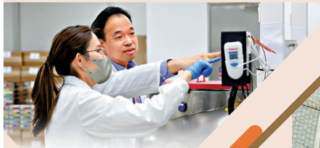
▲特区政府正招攬各地專才，以增強香港的競爭力。