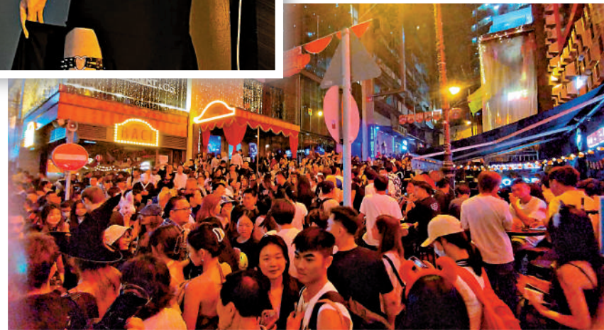
▲萬聖節前最後一個周末，蘭桂坊晚上8時後已迫滿人潮，警方要實施人流管制。