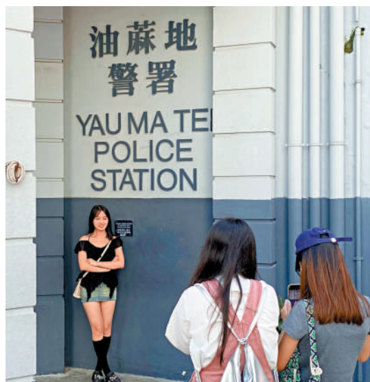
▲不少內地旅客來到舊油麻地警署打卡，因為多部港劇和電影都曾在這裏取景。