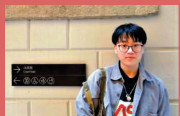
▲詹先生在疫情三年過後又來香港玩，感到有不少變化。

「之前若不是疫情，我真的經常過來。」住在深圳的詹先生，在疫情前經常來港遊玩，最頻密時是一星期一次，走街串巷，搜羅美味，是他的一大樂趣，「有時候我和朋友們開玩笑說，我們是靠鼻子來指路的」，無論是茶餐廳現烤的菠蘿包、小巷後的大牌檔，詹先生都能細數一二，「我和朋友們可能周末（在深圳）逛街悶了，就會坐高鐵過來逛逛，畢竟只需十分數分鐘車程」，港澳通行證是他的常備證件，「甚至身份證都未必天天帶，但出門玩一定記得帶通行證」，他笑道。