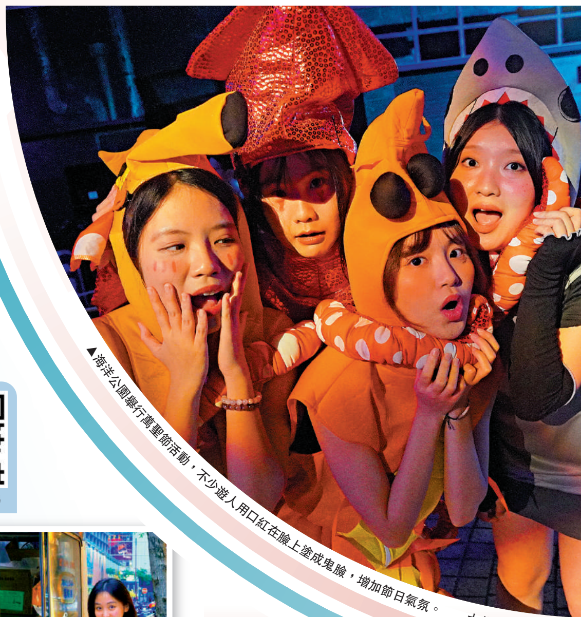
▲海洋公園舉行萬聖節活動，不少遊人用口紅在臉上塗成鬼臉，增加節日氣氛。