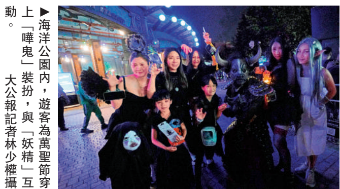
上：海洋公園內，遊客為萬聖節穿上「嘩鬼」裝扮，與「妖精」互動。

在香港迪士尼，巡遊表演、歌舞表演都加入萬聖節元素，大公報記者見到，許多內地遊客在園區標誌城堡前、美式風情街道打卡。每個月都會到迪士尼遊玩的深圳遊客李小姐表示，自小喜歡迪士尼，因此特地辦了全年票，方便自己不時來遊玩。她形容深圳到香港的交通便利，「就好像去另一個區」一樣，除了主題公園外亦不時到港吃喝玩樂。