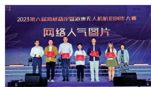
▲10月31日，第六屆海峽兩岸暨港澳無人機航拍創作大賽頒獎典禮在深圳舉行。

香港知名導演李力持談及香港參賽選手作品時表示，香港無人機作品的一大特點是航拍維多利亞港，相對於內地而言題材方面可以再豐富一點。「要有競爭，技術才會越來越好。」