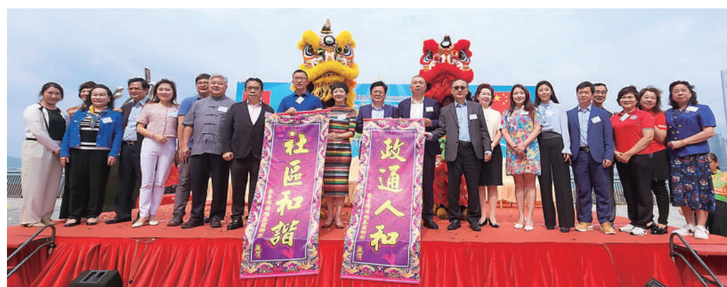
遊園嘉年華「開幕式」開幕式，實主合影。

日前，由香港海南社團總會（下稱總會）、中國香港海口聯誼會主辦，民政事務總署支持的「海南味 瓊州情 海南文化親子遊園嘉年華」假中山公園隆重舉行。活動吸引了大量市民入場參與，共同享受家庭樂的同時，感受到瓊州的熱情和文化底蘊，提升社區的文化內涵，為社區注入新的活力。