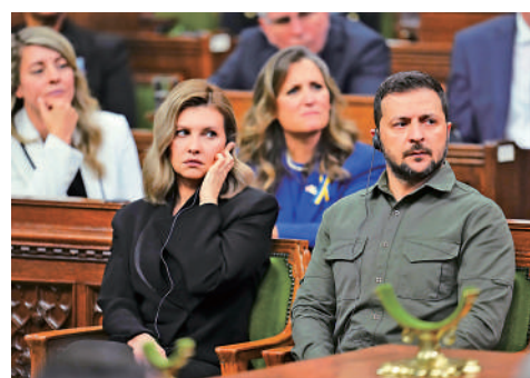
▲澤連斯基夫婦（前排）的海景房被克里米亞當局拍賣。

烏克蘭軍隊10月30日稱，烏軍於10月29日晚「成功襲擊」了克里米亞西海岸防空系統。俄羅斯國防部則表示，俄軍攔截了烏軍向克里米亞發射的8枚「風暴陰影」巡航導彈。