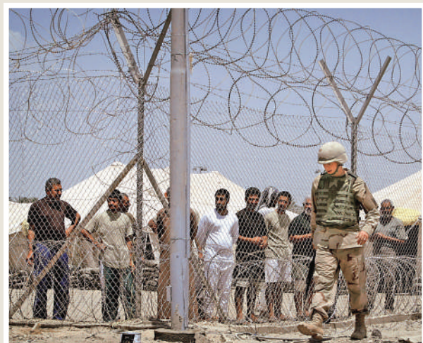
▲美軍在全球多地發動戰爭。圖為美軍士兵2004年在伊拉克巡邏。

普京說，以色列對加沙地帶平民進行「集體懲罰」，相關可怕影像激化了俄羅斯穆斯林平民的情緒反應。他指出，以色列「不合理」的行動促成了這場騷亂。