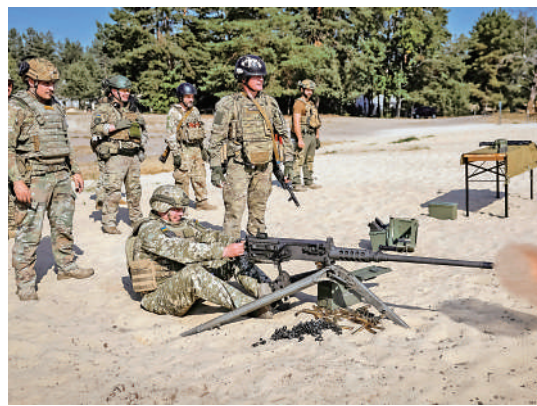
▲烏軍高度依賴美國軍援。圖為烏軍指揮官9月27日使用美製機槍。

美媒援引澤連斯基的助手稱，巴以衝突爆發後，西方關注焦點轉移到中東，澤連斯基認為自己被西方盟友「背叛」。