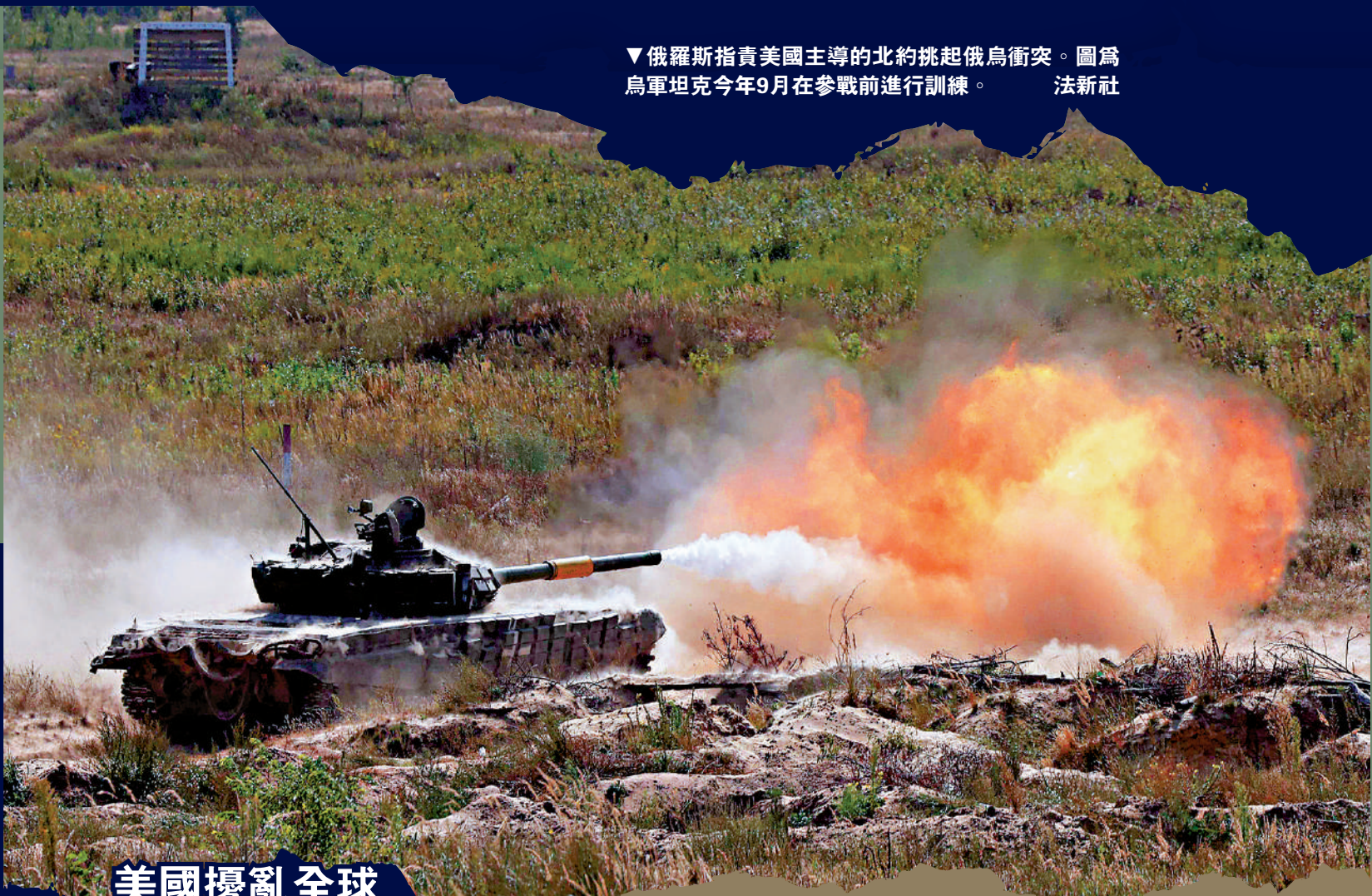
▼俄羅斯指責美國主導的北約挑起俄烏衝突。圖為烏軍坦克今年9月在參戰前進行訓練。法新社

【大公報訊】綜合法新社、BBC、塔斯社報導：俄羅斯總統普京10月30日與俄聯邦安全會議成員、政府和安全機構負責人舉行會議，討論中東局勢及俄羅斯國內民族和安全等問題。普京指出，美國一直在全球四處煽動衝突並從中漁利，包括巴以衝突和俄烏衝突；當下國際社會大多數國家都在呼籲加沙地帶實現停火，但美國及其附庸卻在中東及世界其他地區持續製造混亂。他將美國比作一隻想把全世界拖入其網中的蜘蛛。