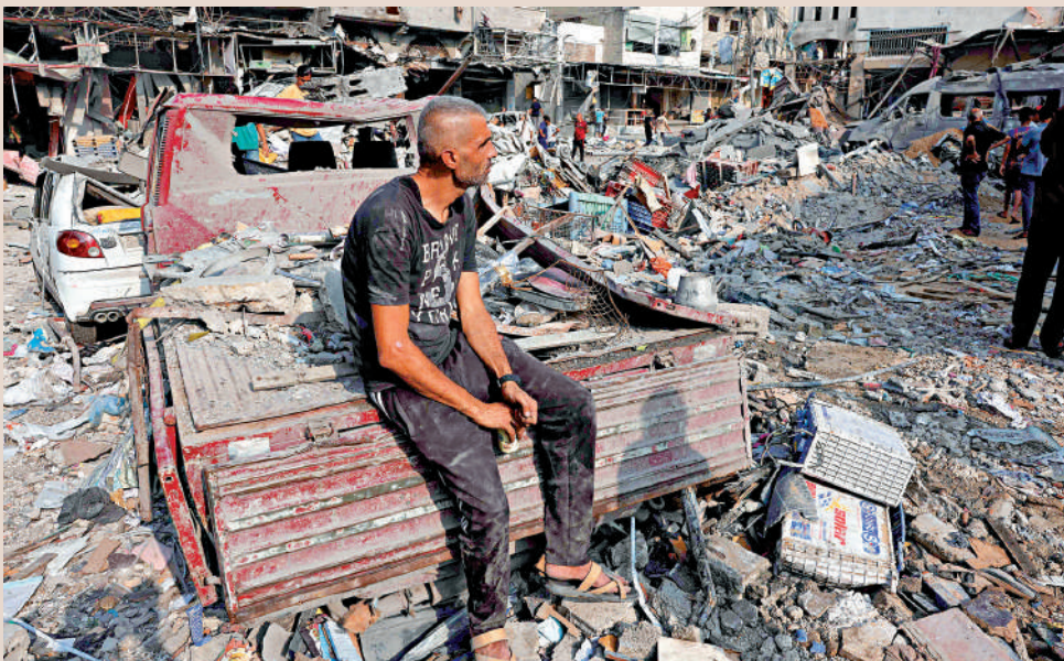
▶本輪巴以衝突已持續近一個月。圖為一名巴勒斯坦男子坐在加沙城的廢墟之上。