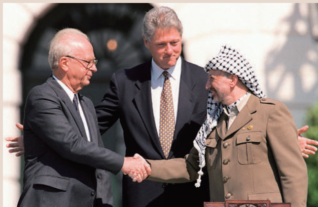
▲1993年9月，在美國總統克林頓（中）的見證下，巴解組織領導人阿拉法特（右）與以色列總理拉賓（左）在白宮簽署《奧斯陸協議》。