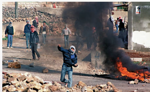
▶1987年12月，巴勒斯坦人向以色列防暴警察投擲石塊。

法塔赫和哈馬斯最大的不同點之一在於是否承認以色列的合法性。在巴以問題上，巴解組織承認以色列的合法性，哈馬斯則不承認以色列，並拒絕與以色列開展和談。哈馬斯多次指責阿巴斯領導的巴勒斯坦政府腐敗、低效，與法塔赫之間發生了激烈的權力鬥爭和武裝衝突。2017年，哈馬斯首度接受法塔赫在約旦河西岸與加沙地帶建立巴勒斯坦國的主張，但仍然拒絕承認以色列，並維持武裝對抗的立場。