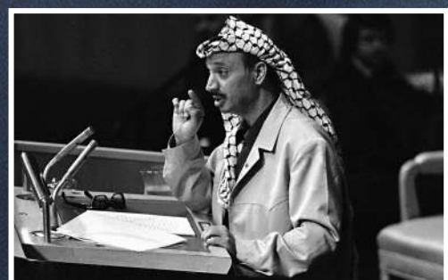
▲巴解組織領導人阿拉法特1974年在聯合國發表講話。資料圖片