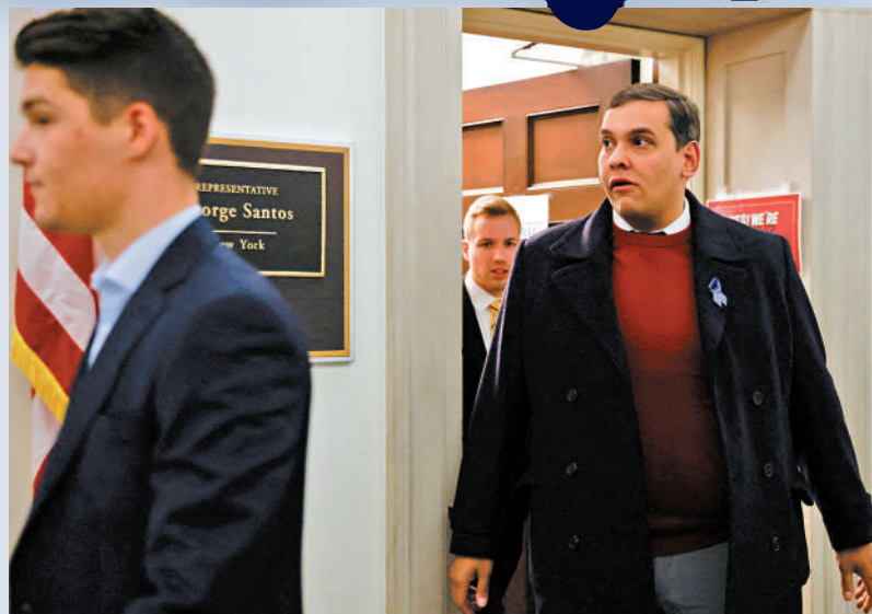
▲桑托斯1日前往國會眾議院。

【大公報訊】綜合CNN、《紐約時報》報道：美國眾議院於當地時間1日投票，以179票支持、213票反對的結果，否決驅逐紐約州眾議員桑托斯的動議。桑托斯現面臨23項聯邦刑事指控，包括電信詐騙、洗錢、盜取公共資金、虛假陳述等，但他仍然保住了烏紗帽。共和黨和民主黨都出於各自的盤算，最終投票將如此劣跡斑斑的議員留在眾議院。評論指，這再度凸顯美式民主的荒唐可笑。