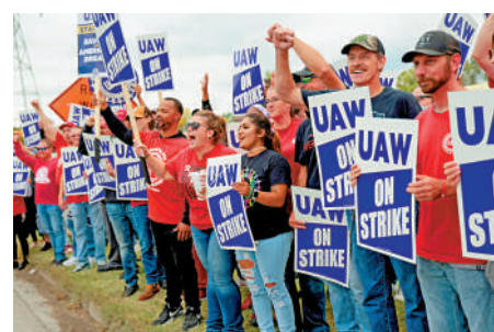
▲密歇根州通用汽車工人舉行罷工。

不過，凡恩亦坦言，UAW之前曾試圖組織特斯拉及其他企業，但均以失敗告終。凡恩預計，非工會公司將會效仿豐田汽車，通過提高工資來阻止員工加入UAW。這家日本汽車巨頭本周宣布，計劃將美國大部分裝配線工人的最高工資提高9.2%。凡恩稱這行不通。他說：「希望我們能到那裏，把他們組織起來，讓他們成為UAW的會員。這樣他們就能充分認識到會員的力量，得到更好的合同。」