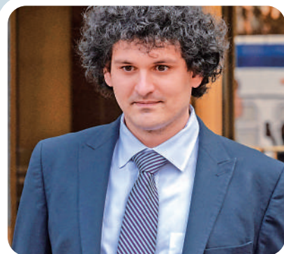
▲薯條哥早前離開紐約聯邦法院。